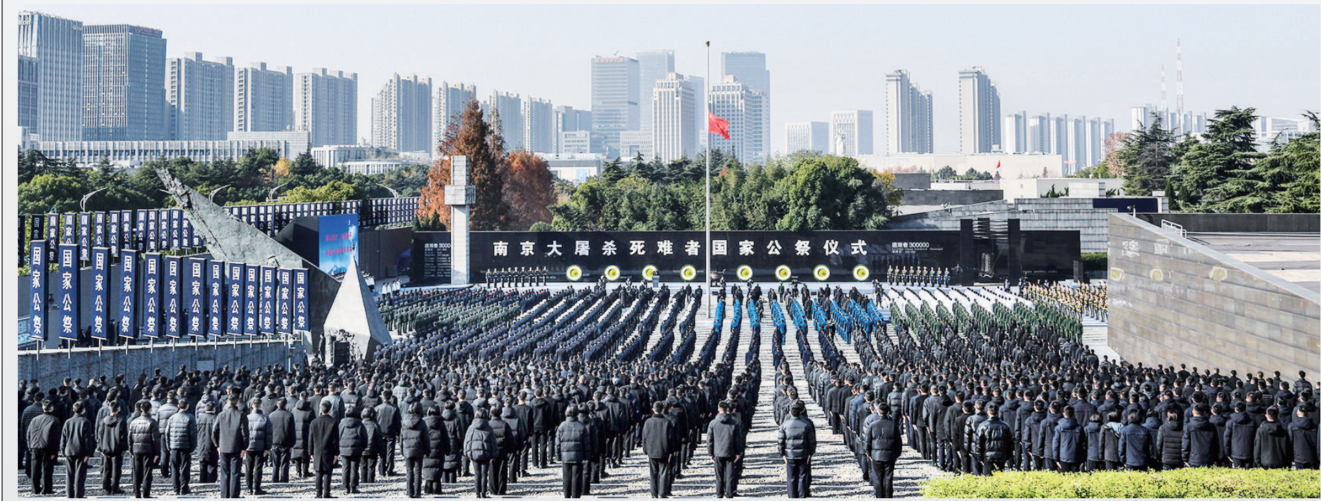
这是12月13日拍摄的南京大屠杀死难者国家公祭仪式现场。

蔡奇讲话后，85名南京市青少年代表宣读《和平宣言》，6名社会各界代表撞响“和平大钟”。伴随着3声深沉的钟声，3000只和平鸽展翅高飞，寄托着对死难者的无尽哀思和对世界和平的无限期许。 中共中央政治局委员、中央政法委书记陈文清主持公祭仪式。全国人大常委会副委员长陈竺、国务委员王勇、全国政协副主席卢展工和中央军委委员、军委政治工作部主任苗华出席。 参加过抗日战争的老战士老同志代表，中央党政军群有关部门和东部战区、江苏省、南京市负责同志，各民主党派中央、全国工商联负责人和无党派人士代表，南京大屠杀幸存者及遇难同胞亲属代表，国内相关主题纪念馆（博物）馆、有关高校和智库专家代表，宗教界代表，驻宁部队官兵代表，江苏省各界群众代表等参加公祭仪式。 2014年2月27日，十二届全国人大常委会第七次会议通过决定，以立法形式将12月13日设立为南京大屠杀死难者国家公祭日。