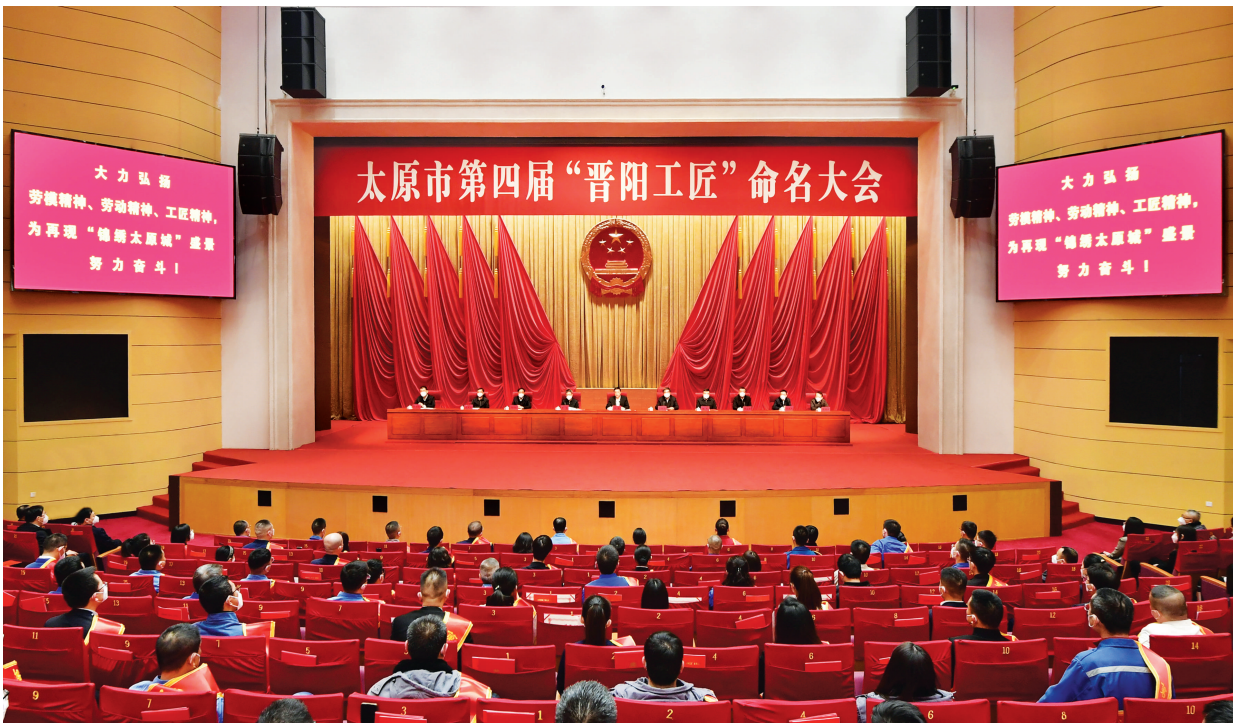
太原市第四届“晋阳工匠”命名大会会场。