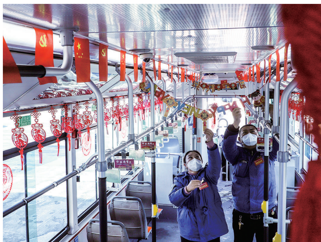
1月15日,在太原公交集团三公司松庄停车场内,司机师傅们正在精心布置车厢,营造出浓浓的节日氛围。