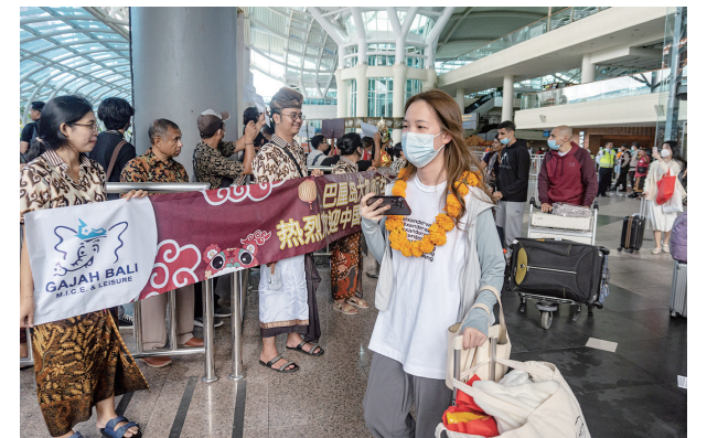
1月22日，在印度尼西亚巴厘岛，中国游客佩戴欢迎花环走出巴厘岛伍拉莱国际机场。