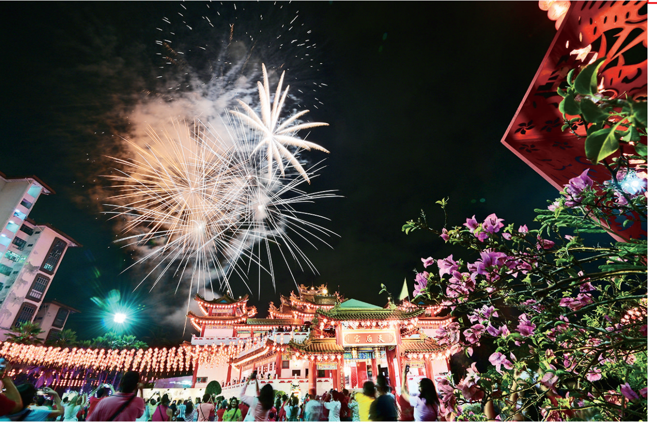
1月22日零时许，马来西亚吉隆坡的天后宫燃放烟花，庆祝新春佳节。

输研究员单靖在生活中感受到中欧班列的实惠便捷，他在春节前下单的中国美食年货通过中欧班列准点送达。 随着中国优化调整疫情防控政策，中国经济的活力和潜能将进一步彰显和释放。国际机构、工商企业界人士纷纷期待，中国“春节经济”的东风将送来新的机遇和繁荣。 美中贸易全国委员会会长克雷格·艾伦表达了信心，认为春节期间中国经济将呈现爆发式增长。他表示，包括能源、制造业、化工等不同行业的成百上千家美国企业都热切期盼进一步拓展在华业务。德国之声电台网站文章说，德国经理人纷纷返回中国，很显然，德国企业不想错过外界所期待的世界第二大经济体的复苏。 据《华盛顿邮报》报道，高盛公司和凯投国际宏观经济咨询公司分析师都上调了对中国经济增长预测。报道还援引国际货币基金组织总裁格奥尔基耶娃的话说，中国的复苏能力极有可能成为“2023年全球经济增长的一个重要因素”。 人们感受到了机遇带来的暖意。一查厚厚的登机牌记录着以色列企业家娅埃尔·埃纳夫30多年来同中国的缘分，也承载着她对发展的期待。今年，埃纳夫将继续为以色列高科技企业在中国寻找合作伙伴和商机。新春之际，埃纳夫表示，“中国能经受住一次次考验，往往很快走出逆境，这种韧性将一以贯之”。 这个春节，万里之遥的尼日利亚港口城市拉各斯传来好消息。由中国企业承建的莱基深水港将于1月底正式开港运营，又一抹新的亮色呈现在非洲大陆。 尼日利亚官员相信，莱基港将使拉各斯成为中西非地区的海运物流中心，并在未来几年为尼日利亚创造近20万个直接和间接工作岗位，有效释放尼日利亚经济发展潜力。作为中国、法国和尼日利亚三方合作的商业项目，莱基港对未能在非洲进一步推进“一带一路”合作具有重要意义。 今年是共建“一带一路”倡议提出10周年。新春之际，国际社会共同期待这条造福世界的“发展带”更加繁荣，惠及人类的“幸福路”更加宽广，让沿线人民生活更加红红火火。 今天的中国，是充满生机活力的中国，也是紧密联系世界的中国。中国经济韧性强、潜力大、活力足，长期向好的基本面依然不变。展望新的一年，人们相信中国将一如既往为世界创造机遇，与世界共享机遇，让发展的红利更好惠及各国人民。 合作年·携手向未来 “在我们即将步入兔年之际，我很高兴送上我最诚挚的祝福，兔象征着活力和机敏。这是人类面临艰难和考验时所需要的品质。”18日，联合国秘书长古特雷斯在视频中向全球华人发出春节问候。 古特雷斯已连续多年送上中国农历新年祝福，每次拜