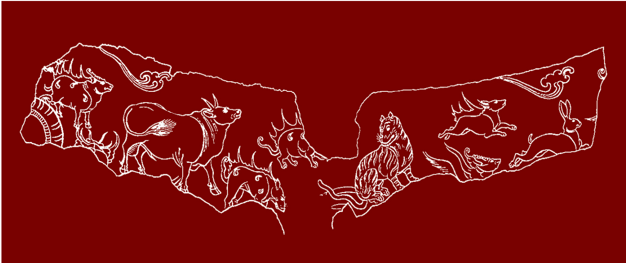
娄睿墓出土的十二生肖壁画图(北齐)