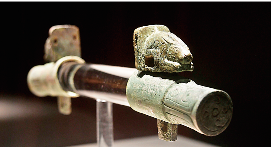
兔形铜辖铜轡(西周)