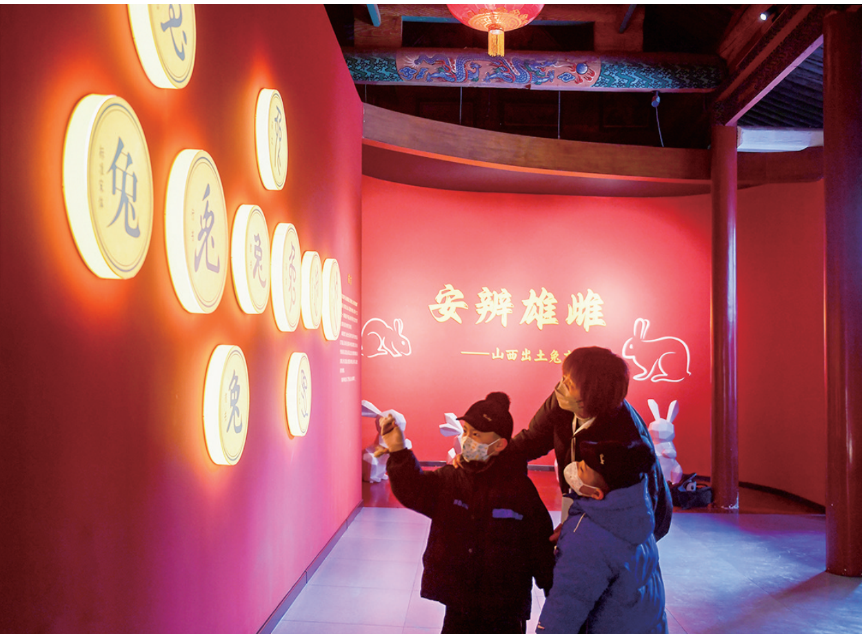
“安辨雄雌——山西出土兔文物展”展厅