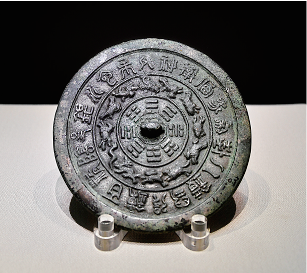
十二生肖八卦铭文铜镜(唐)