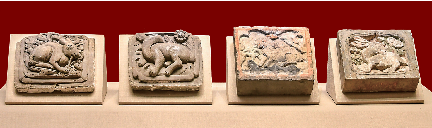
兔影壁砖雕 彩绘兔砖雕(清)