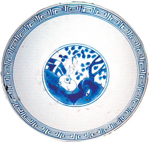
青花玉兔桂树纹瓷碗(明)