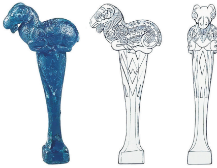
战国卧羊琴轸钥及正侧面线描图(山西博物院藏)

这件来自战国时期的卧羊琴轸钥,是一件既有实用性,又有艺术感,同时还具有吉祥寓意的艺术珍品。想必与它相配套的古琴,一定也是不同凡响。