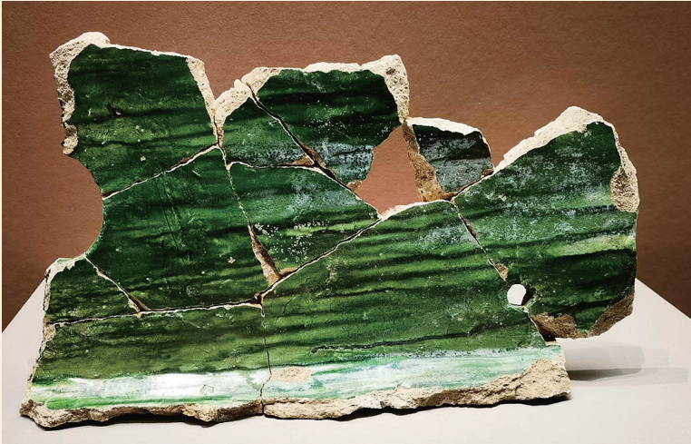
佛阁遗址出土建筑琉璃构件(太原市文物考古研究院藏)

有的覆纯绿釉,有的黄绿相间,有的饰有精巧纹饰,艺术语言和表现手法非常丰富。虽然这些建筑构造破损严重,但从其鲜艳的釉色和漂亮的纹饰中,依然能够看出当年佛阁建筑的精美与恢宏。