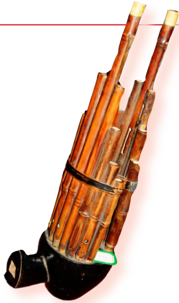
彭德怀送给李二孩的竹笙 (八路军太行纪念馆藏)

开馆以后,李二孩专门把这把竹笙捐赠给了纪念馆,并把这个故事讲述给馆里的工作人员,好让更多的人看到和听到关于这件珍贵的礼物背后的动人故事,发挥洗涤激荡心灵、弘扬革命传统的教育意义。1999年5月,国家一级文物专家鉴定组将这把竹笙评为国家一级文物。