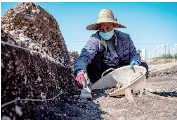
考古工作者在云南古城村遗址现场进行清理发掘工作(2022年11月24日摄)。

据新华社昆明2月15日电 (记者 伍晓阳、严勇)滇文化是云南青铜时代最具代表性的考古学文化。15日,国家文物局召开“考古中国”重大项目重要进展工作会,其中通报了云南晋宁古城村遗址考古成果。古城村遗址是