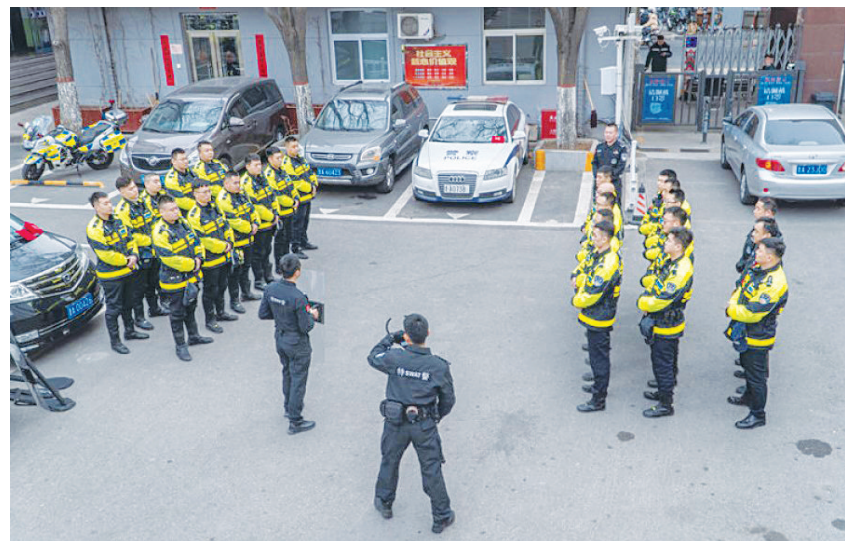
龙城铁骑立足实战需求和岗位要求,组织开展反恐处突最小作战单元现场处置技能演练,增强铁骑队员反恐意识和自我防范意识,增加处置突发事件的经验,充实了警务战术技能,有效提升反恐处突、协同作战、临场应变和自我保护能力。

乱放的危害,并对违停行为进行曝光,积极营造浓厚的整治氛围;构建“交警+网格员”工作模式,充分利用网格员人熟、地熟、情况熟优势,将早、中、晚高峰时段作为重点整治时段,通过微信群发送提示信息,提示驾驶人尽快将车辆驶离,同时将交通安全宣传融入网格员日常工作,让“小网格”助力交通“大安全”;持续优化勤务部署,加大路面巡逻巡查力度,全面强化重点时段、重点路段违停的治理,坚决保障辖区路面畅通、有序。