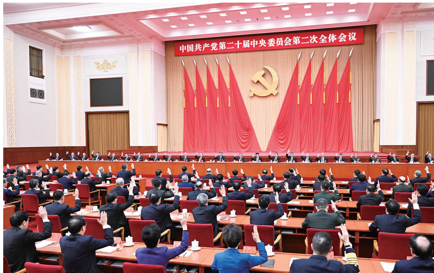
中国共产党第二十届中央委员会第二次全体会议,于2023年2月26日至28日在北京举行。中央政治局主持会议。

新华社北京2月28日电 中国共产党第二十届中央委员会第二次全体会议公报 (2023年2月28日中国共产党第二十届中央委员会第二次全体会议通过)