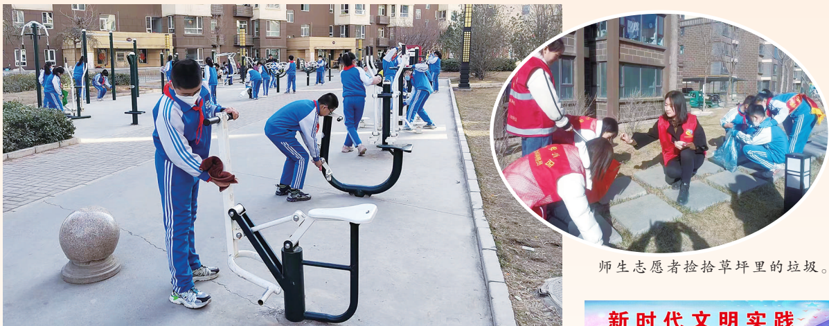
师生志愿者们收拾草坪里的垃圾。