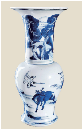
《鹿鹤同春》青花瓷瓶（太原博物馆藏）