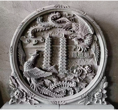
砖雕《凤还巢》（山西晋韵砖雕艺术博物馆藏）

“无雕不成屋，有刻斯为贵。”漫步三晋大地，无论是晋商大院，还是民间古宅，随处可见精美的砖雕。位于清徐徐沟镇新庄村的山西晋韵砖雕艺术博物馆，集纳了万余件精美的砖雕，这些镌刻于青砖上的艺术，承载着山西的历史印记和文化脉络，写满了清徐千百年来的砖雕文化故事。