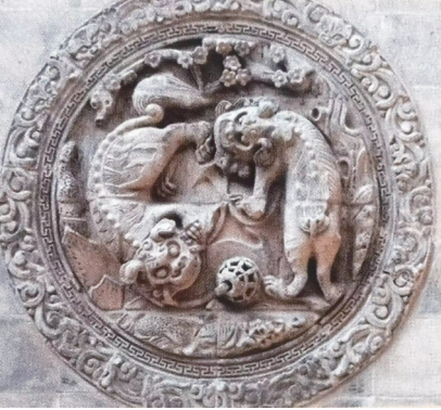
清代砖雕《双狮滚绣球》（山西晋韵砖雕艺术博物馆藏）