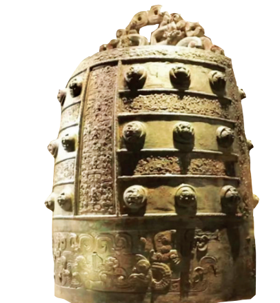
兽首衔凤纹铸钟（山西博物院藏）