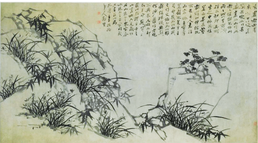
郑板桥《兰竹石图》（山西博物院藏）

中有几处嶙峋怪石，怪石上面杂点兰竹，错落生成，在画面的右上方有一篇155字的题画文，别具意趣。他的书体是其自创的“六分半书”，特点是以真、隶为主，揉合真、草、隶、篆各体，并用作画的方法来写，用笔方法变化多样，或如兰叶飘逸，或似竹叶挺劲，横竖点画或楷或隶、或草或篆，挥洒自如而不失法度；结体扁扁，又多夸张，肥瘦大小，偃仰斜斜，呈奇异狂怪之态；章法也很别致，疏密相