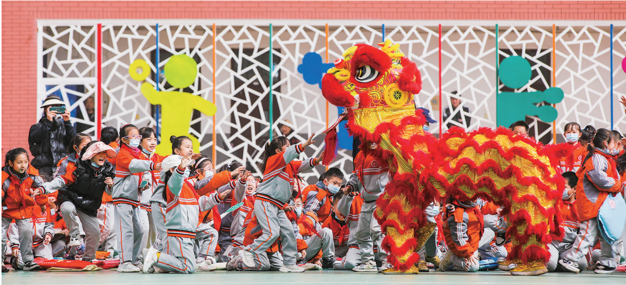
小店区文旅局非遗中心的非遗传承人及民俗文化老师走进校园,为同学们送来非遗表演。

本报讯 “舞龙”“舞狮”“背棍”“二鬼摔跤”“川剧变脸”……4月11日,一场主题为“弘扬传统文化 传承华夏经典”的非遗文化进校园展示活动,在小店区实验小学操场热闹上演。孩子们不仅近距离观赏,还积极参与互动,觉得此次活动新鲜有趣,大饱了眼福。