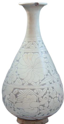
白釉剔花玉壶春瓶

釉。另一件为灰胎,胎质坚硬,直口,圆唇,弧腹,圈足,内壁及口部施白色化妆土,然后罩一层透明釉,釉色泛黄,内底有四枚椭圆形支钉痕,圈足上有四处支钉痕,圈足底部墨书“张□□”三字。