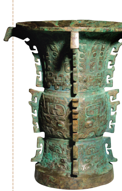
义尊(山西博物院藏)

铭文中的“父乙”和族徽“丙”,是以甲、乙、丙、丁等天干来命名的。此为“日名”,“日名”和使用族徽铭文都是商人的习惯。据此可知,义应该是商人族群中丙族人的一支。丙族器物在山西灵石、河南安阳、陕西宝鸡都发现过,尤其是山西灵石旌介发现的三座商代晚期墓葬中出土大量带“丙”字族徽铭文的青铜器,说明丙族人先后在商周王朝的核心地区活动,也有一支丙族人在山西活动。结合历史文献和考古发现的资料,我们有理由认为,义在西周王朝建立的过程中发挥了相当大的作用。因此,武王对义有如此厚重的赏赐,义也将此事作为家族的荣耀,铸造了尊和彝,并铭刻文字以记载受到赏赐的事情,祭告先祖、传颂于后代。