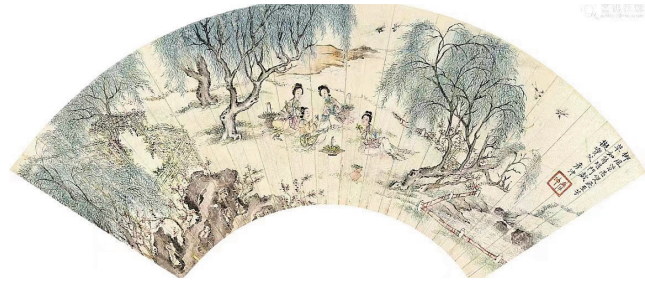
《柳荫仕女图》(清刘彦冲绘)