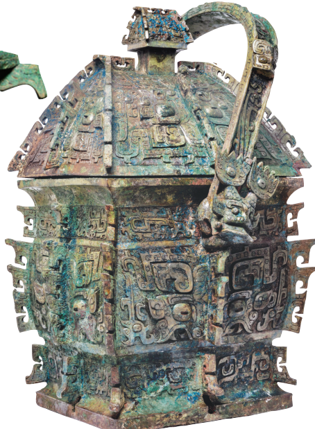
义方彝(山西博物院藏)