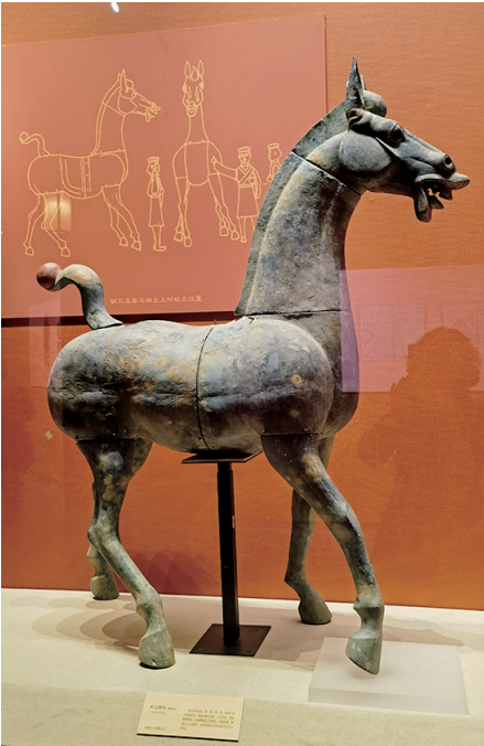
东汉大铜马俑复制品(绵阳市博物馆藏)

木马高约70厘米,呈站立状,头微低,颈长而圆实,短鬃,胸部轮廓饱满,线条优美,骨骼质感清晰,十分健壮。马尾梳成球状鬃向上卷起,颇具动感。马身用整木新削雕作而成,与尾部榫卯相接。通体髹黑漆,光可鉴人。骑马俑紧贴木马,右小臂残缺,大腿肌肉发达、棱角分明,线条刻画清晰。