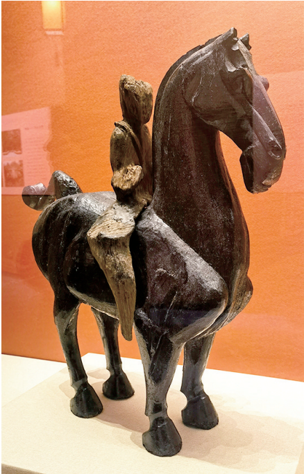
西汉漆木马俑及骑马俑(绵阳市博物馆藏)

4月9日,“涪城汉韵——四川绵阳市博物馆藏汉代精品文物展”在太原博物馆开展,两匹著名的汉代大马——西汉漆木马和东汉大铜马随汉代说唱陶俑、东汉青铜摇钱树等知名文物集体“奔赴”太原。