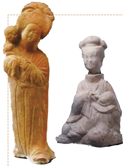
唐母子俑(左,陕西历史博物馆藏)和东汉哺乳俑(右,四川博物院藏)

除了斛律彻墓之外,在张肃俗墓、娄睿墓和徐显秀墓中都出土有载货载人的骆驼俑。娄睿墓墓道壁画中有四人五驼组成的胡商驼队图,徐显秀墓出土的极具西域风情的蓝宝石戒指等都说明了北朝时期中外文化交流的频繁。除此之外,云冈石窟由北魏孝文帝在北魏都城平城(今山西大同)开凿,其18窟北壁东侧胡风梵貌的弟子、12窟主室南壁的胡商队伍,以及石窟中随处可见的忍冬纹装饰、琵琶、箜篌、箏篥等十种西域乐器,无不展现了当时丝绸之路贸易往来的盛况。