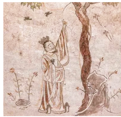
太原市万柏林区唐代郭行墓《树下老人图》(太原北齐壁画博物馆藏)

现在年轻人拍照,常会将中指与食指竖起,比成“V”的形状,表胜利、开心之意,人们戏称此手势为“剪刀手”。但这个手势,居然出现在太原的唐代壁画墓中,让人在诧异之后忍俊不禁。