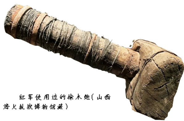
红军使用过的榆木炮(山西烽火抗战博物馆藏)

1935年12月,中共中央在瓦窑堡召开的政治局会议上,明确提出党的基本策略任务是建立广泛的抗日民族统一战线,提出了“抗日反蒋、渡河东征”的口号。