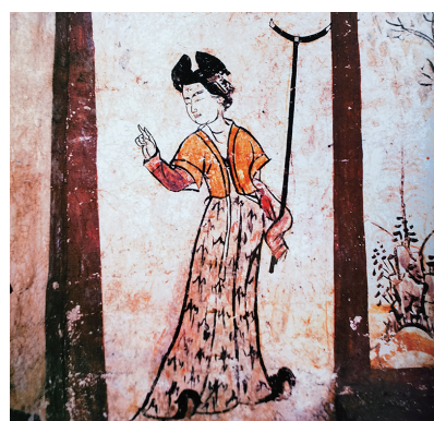
太原市晋源区唐代壁画墓西壁侍女图