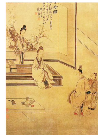
清康涛《贤母图》(首都博物馆藏)

下面这幅《贤母图》是清代康涛的绘画作品,从此图题款“临民听狱,以庄以公。哀矜勿喜,孝慈则忠”,可知此为贤母向即将离家赴任的儿子所作的教诲。画家以高超的笔法将其母严肃训诫却又暗含离别伤感之态,儿媳恭顺侍立而又对丈夫依恋不舍之情,儿子恭敬聆听却踌躇难离之意,刻画得生动传神。画风严谨,设色清淡,具有强烈的艺术感染力。