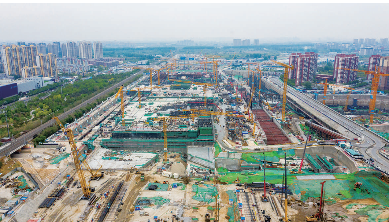
这是在北京市通州区拍摄的建设中的北京城市副中心综合交通枢纽(2023年4月23日摄,无人机照片)。