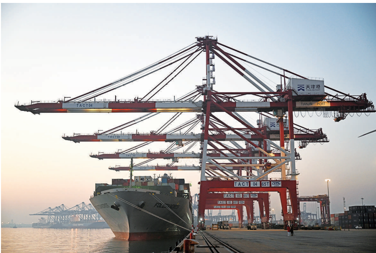
一艘货轮靠泊在天津港联盟国际集装箱码头进行装卸作业(2023年1月1日摄)。