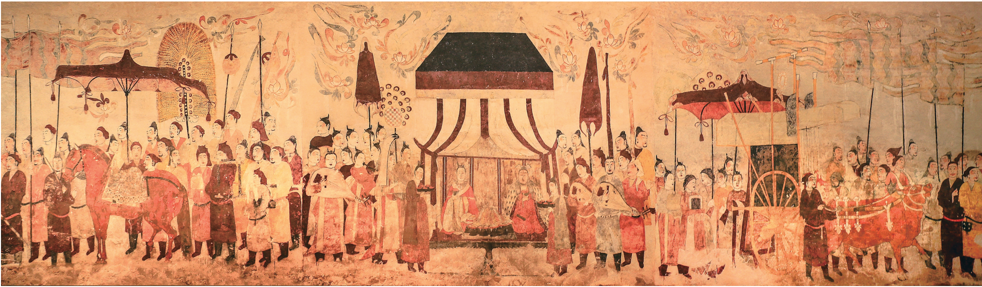
徐显秀墓壁画复原图