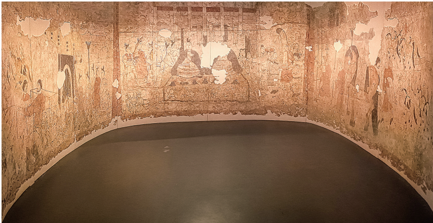
水泉梁墓壁画东北西三壁复原图