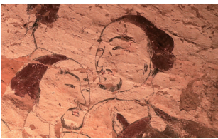
徐显秀墓墓道壁画(局部)