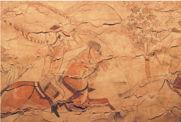
九原岗墓壁画狩猎图(局部)