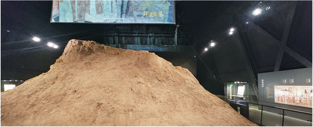
徐显秀墓封土堆原址保护