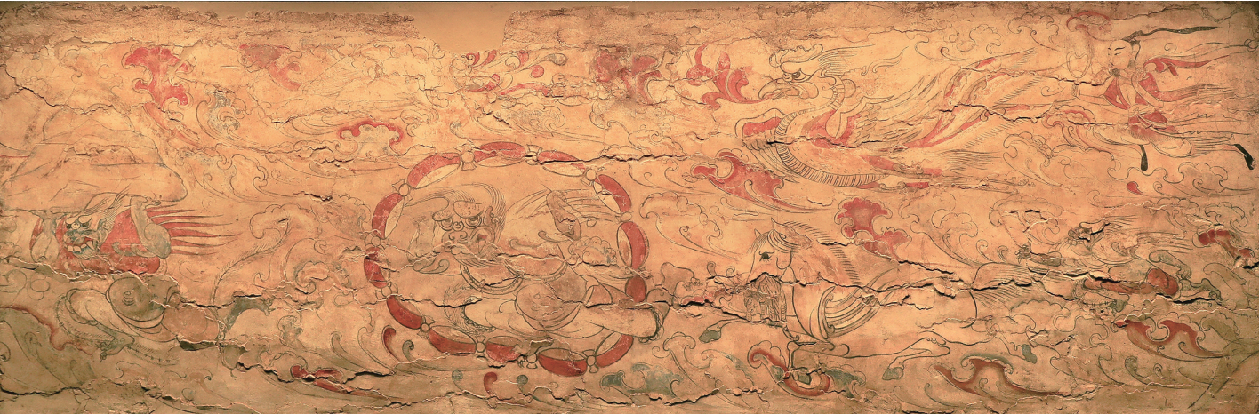
九原岗墓壁画升天图(局部)