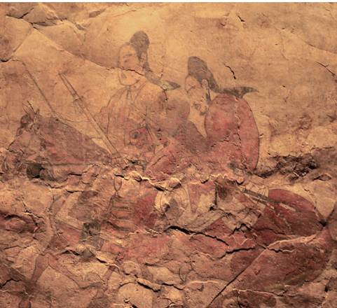
娄叡墓壁画群马图(局部)