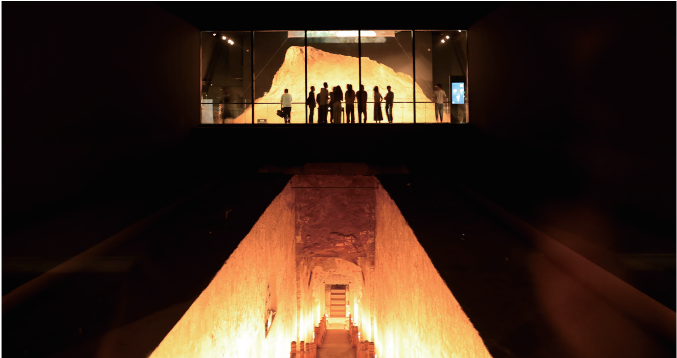
徐显秀墓墓道及展厅