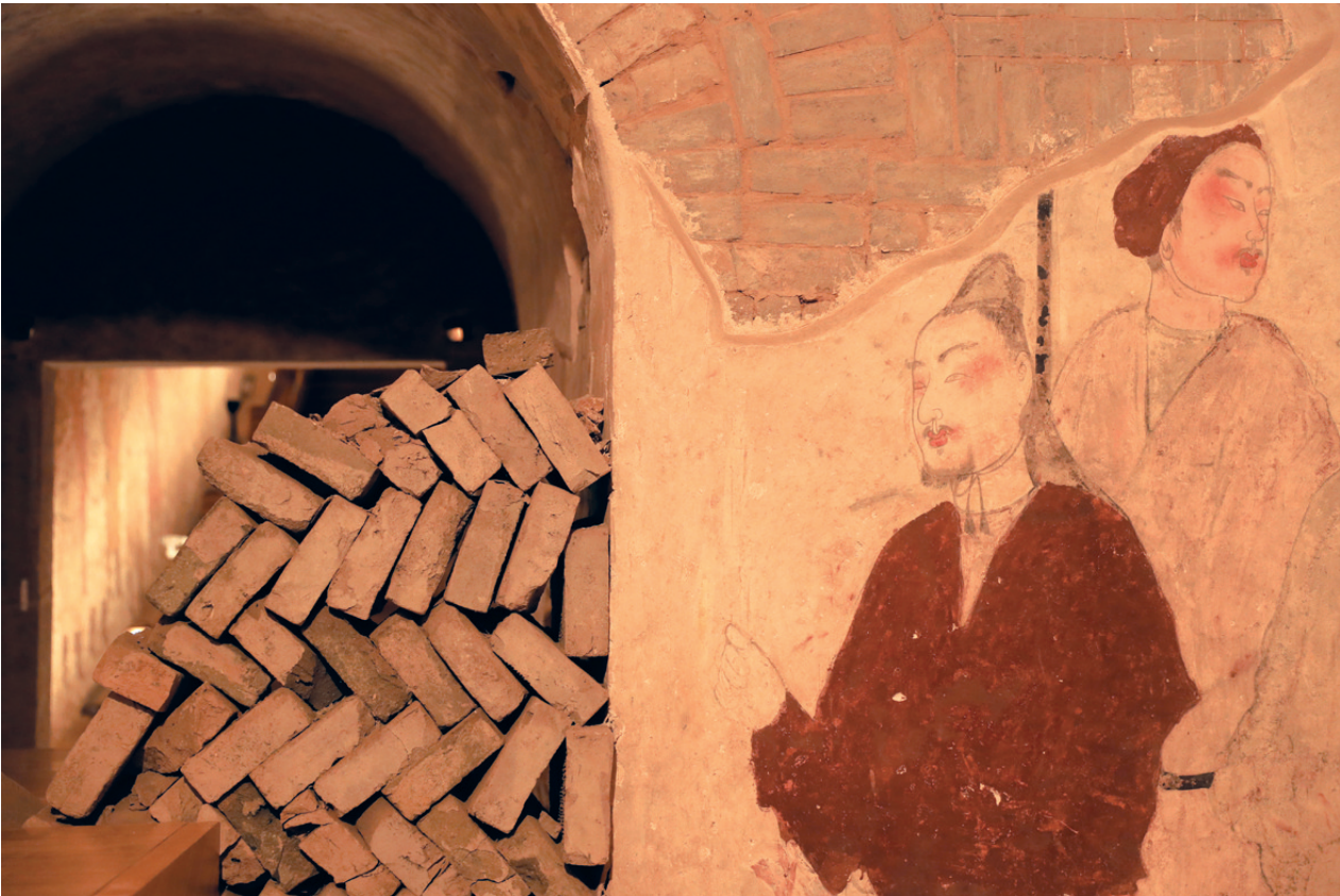
徐显秀墓壁画(局部)