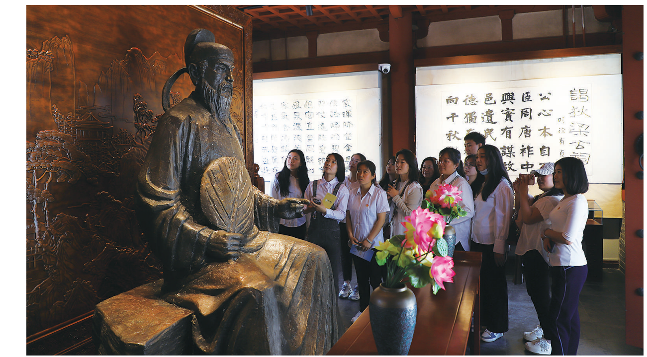
5月23日，义井东社区组织党员走进狄仁杰文化公园开展“弘扬廉洁精神 坚定理想信念”主题党日。通过参观学习，接受廉政文化熏陶，筑牢思想防线。