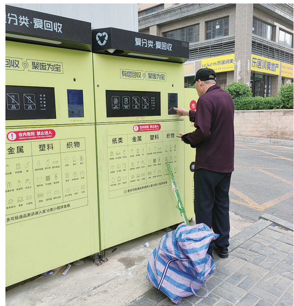
图为市民在智能回收机前操作。

居民是推动生活垃圾分类化、减量化的重要力量。为从源头推进此项工作，市容环卫部门积极推进小区“撤桶并站”，设置分类投放点5600个。同时推进生活垃圾分类市场化改革，委托专业公司实施清扫保洁、垃圾分类、垃圾收集、无人管理保洁等环卫作业一体化作业，不断提高分类投放覆盖率。