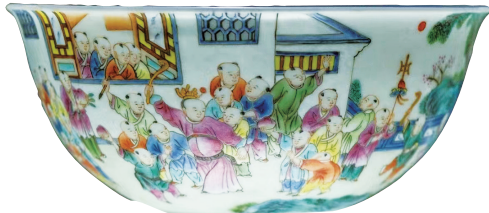
清粉彩婴戏图碗（山西博物院藏）

“婴戏图”是中国古代很早就有的一种纹饰，有早生贵子、多子多福、五子登科、儿孙满堂等多种吉祥寓意。 这只清嘉庆粉彩婴戏图碗，高5.6厘米，口径11.2厘米，底径5厘米。胎白壁薄，简洁大方，外壁满饰婴戏图。64名孩童在拱桥、流水、房屋、山石、树木构成的背景中，或牵手游戏，或追逐打闹、嬉戏玩耍。人物表情细腻生动，场景热闹活泼，画法工整细致、栩栩如生。器物做工精良，色彩鲜艳纯正，胎体洁白细腻，不失为一件婴戏图杰作。