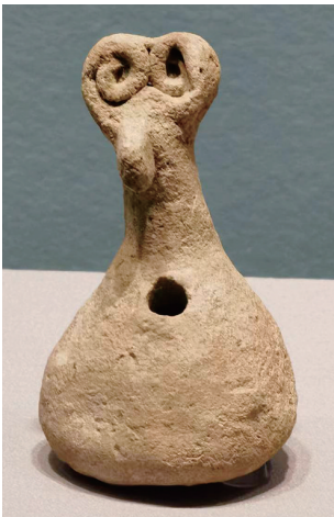
青铜时代早期泥塑人偶（大马士革国家博物馆藏）

这些大眼人偶，现藏于大马士革国家博物馆，上世纪30年代出土于距今4900年的叙利亚东北部“眼庙”遗址。 这些眼睛雕像在形状上差异很大，奇形怪状，据推测可能代表着不同的涵