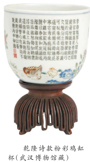
乾隆诗款粉彩鸡缸杯（武汉博物馆藏）

这件粉彩鸡缸杯，为清乾隆时期仿明成化斗彩鸡缸杯的作品。 杯外壁一侧以粉彩描绘了童子戏鸡的场景。另一侧绘雌鸡带领数只雏鸡悠然觅食的场景。杯体上印有乾隆皇帝132字御题诗，显示出乾隆皇帝对于此类题材及背后典故的特殊喜爱——“朱明去此弗甚遥，宣成雅具时犹见。寒芒秀采总称珍，就中鸡缸最为冠”。