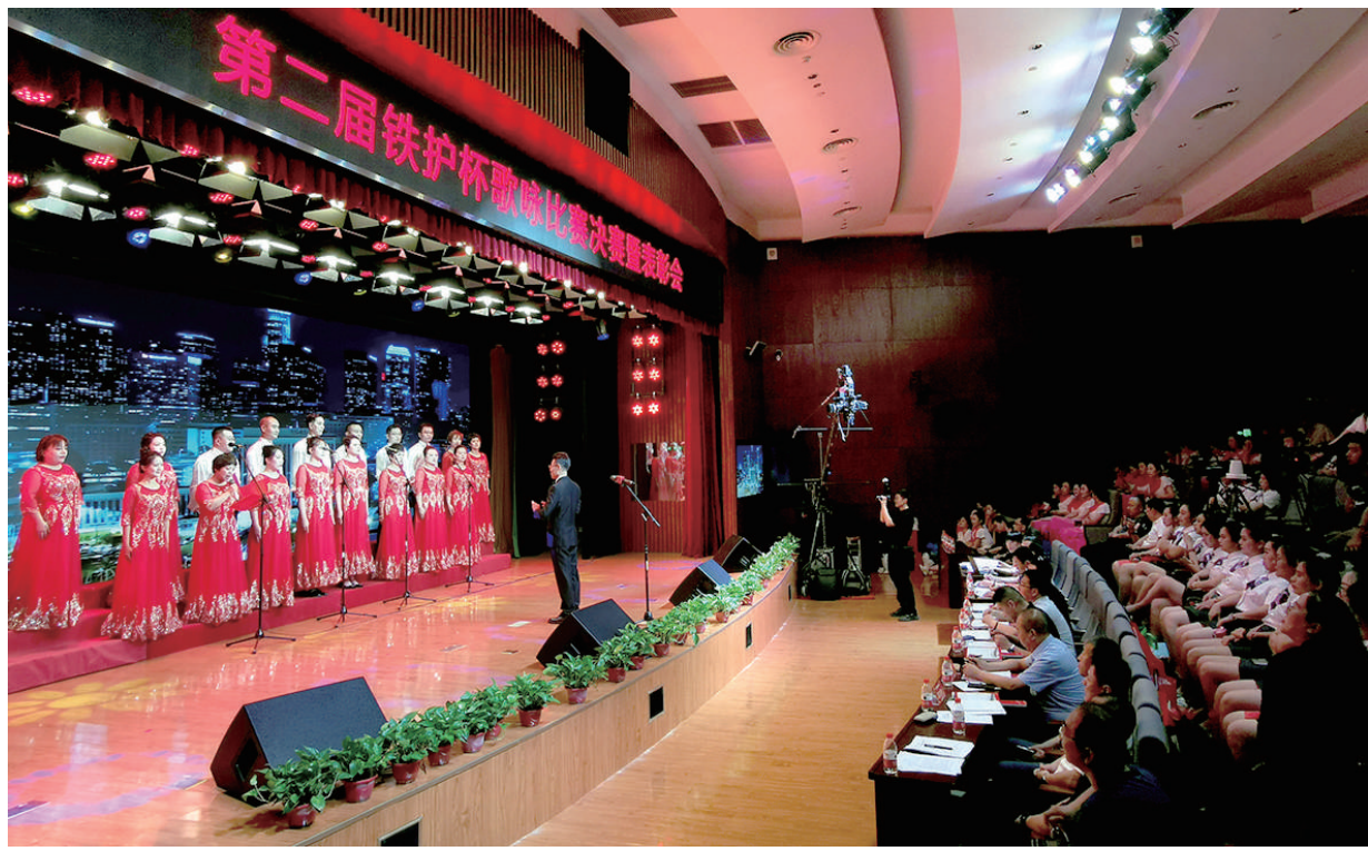
6月12日，市委政法委主办的第二届铁护杯歌唱比赛在市图书馆举行。由各县(市、区)的社区网格员和护路员组成的10支代表队用歌声表达对铁路护路工作的热爱。