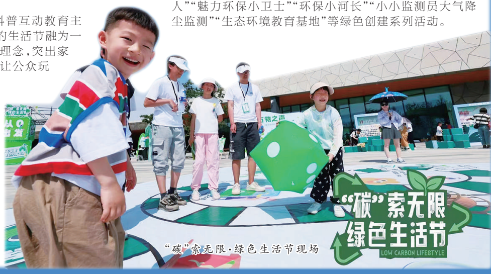
“碳”索无限·绿色生活节现场

市生态环境局有关负责人表示,将继续在全市范围内开展“环保好市民”“绿色文明家庭”“绿色学校”“最美基层环保人”“魅力环保小卫士”“环保小队长”“小小监测员大气降尘监测”“生态环境教育基地”等绿色创建系列活动。