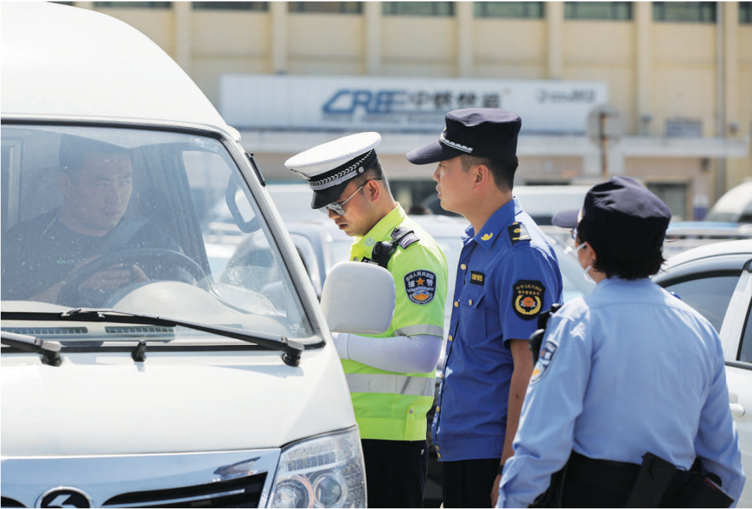
6月22日,市交警支队、迎泽区文庙派出所、火车站管委会、市客运办在太原火车站站前广场开展联合执法,加强路面管控,确保市民安全畅通有序出行。

畅想着无边的青纱帐,吃一碗红面擦尖儿,浇一股浓醇醇的陈醋,配一杯清冽冽的汾酒,小小的高粱就这么润物无声地在人们的舌尖完成了一二三产融合,滋养着经济和生活的底气。