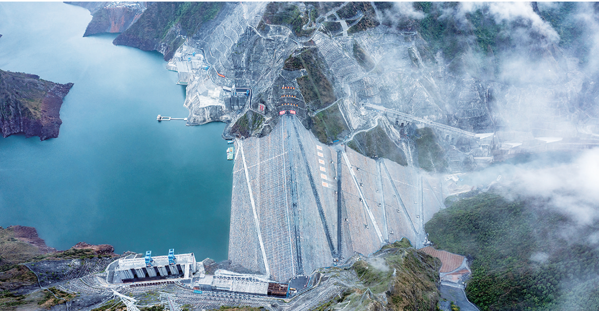
这是雅砻江两河口水电站（二〇二三年六月二十二日摄，无人机照片）。

“节能降碳，你我同行”——7月10日，第33个全国节能宣传周在广州启动。围绕重点行业企业节能降碳行动、绿色生活创建行动等多个活动，今年的节能宣传周旨在倡导全社会为加快绿色发展、建设美丽中国贡献更大力量。 党的二十大报告提出，推进生态优先、节约集约、绿色低碳发展。各地各行业紧扣碳达峰碳中和目标任务，促进发展方式的降耗升级，积极营造节能降碳浓厚氛围，加快促进经济社会发展全面绿色转型。