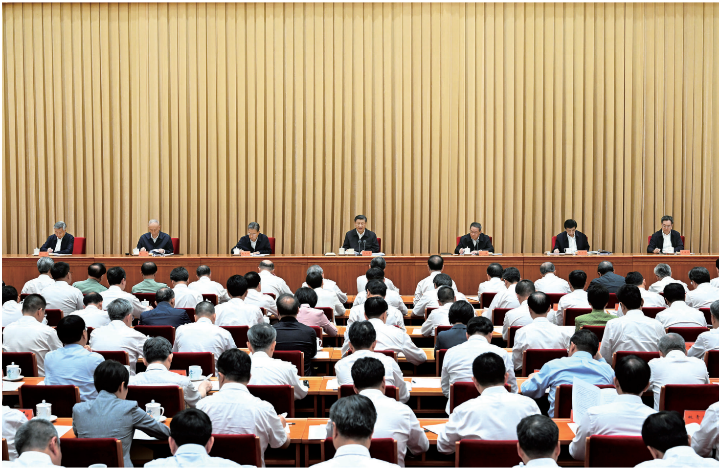
7月17日至18日,全国生态环境保护大会在北京召开。中共中央总书记、国家主席、中央军委主席习近平出席会议并发表重要讲话。李强、赵乐际、王沪宁、蔡奇、丁薛祥、李希出席会议。