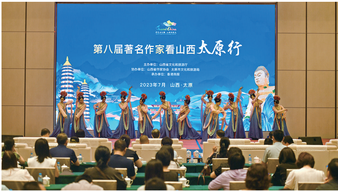
7月18日,由省文旅厅主办的第八届“著名作家看山西·太原行”启动仪式在我市举行。