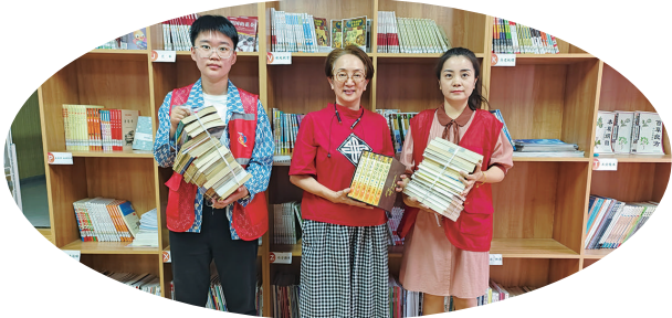
居民梅女士(中)向社区图书室捐赠书籍。