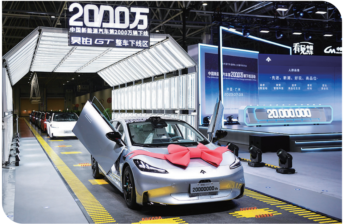
在广州广汽埃安第一智造中心拍摄的中国新能源汽车第2000万辆下线活动现场（7月3日报）。

家居消费涉及领域多、上下游链条长、规模体量大。6月29日召开的国务院常务会议审议通过《关于促进家居消