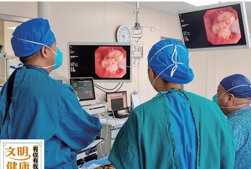
图为医生在做手术。

本报讯 气道是人体主要的“生命通道”,一旦堵塞,分分钟可能夺命。许多恶性肿瘤患者,癌细胞在气道内迅速疯长,成为“锁喉”肿瘤。近日,山西白求恩医院呼吸与危重症医学科成功实施国内首例呼吸内镜恶性气道狭窄化学消融术,标志着该院在恶性气道狭窄呼吸介入治疗方面又上了一个新台阶。