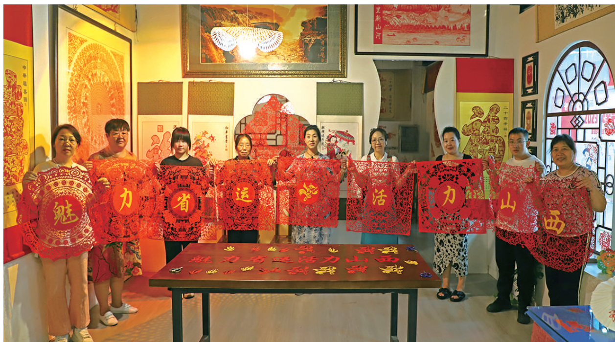
8月6日，市剪纸协会的会员们用巧手剪出“魅力省运 活力山西”，以此表达对省运会的祝贺。

活动由尖草坪区委、区政府主办，紧紧围绕太原大力推进文旅融合发展、建立中医药强市的奋斗目标，组织开展傅山学术思想传承人选拔培养、“书香政协、守正创新”主题书画展、第九届傅山拳法比赛、文艺演出和名老中医开展义诊等系列活动。活动期间，太原市晋剧艺术研究院在傅山园广场连续上演7场优秀传统剧目，同时，尖草坪区文旅局主办的傅山文化新媒体直播第一课正式开讲。 (张波)