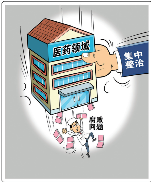
集中整治 新华社发 朱慧卿 作