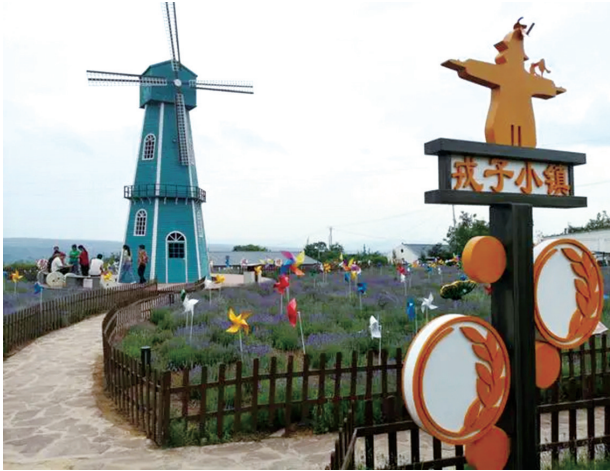
龙鼻村的薰衣草花海吸引游客前来度假休闲。

具有鲜明价值取向,同时注重提升影片艺术性,新主流电影坚持守正创新,频频成为各大重点档期票房“主力军”。 在有关专家看来,新时代新征程的万千气象,给电影人积累了宝贵的创作题材;民族自豪感和文化自信心的高涨,也有利于新主流电影在受众中引起广泛共鸣。 让英雄回归寻常烟火,逐渐成为新主流电影创作者们的共识。例如,《长空之王》既呈现年轻试飞员的英勇与果敢,也展现了他们的成长历程;《狙击手》以小见大,以独特视角呈现抗美援朝战争,生动刻画年轻的狙击五班战士群像…… “新主流电影通过对个体情感的书写,突破了以往同类影片对主流价值概念化、简单化的表现,更好地引发观众的共情共振。”中国传媒大学戏剧影视学院副院长张宗伟说。 一批深入生活、扎根人民的现实题材作品,带着温暖底色,描摹昂扬向上的时代风貌。 《热烈》以亚运会霹雳舞比赛项目作为题材,折射出普通人为了梦想执着向前;《奇迹·笨小孩》讲述普通人在深圳奋力拼搏,展现他们的逐梦人生……这些影片关注时代背景下个体的人生际遇,致敬每一位不懈奋斗的普通人。 从电影工业持续发展 中积累经验 气贯骤降、巨浪翻滚、陨石来袭……今年春节档,《流浪地球2》以宏大的视觉奇观、精彩的故事讲述,探索国产科幻电影发展的更多可能,折射出我国电影工业的不断进步。 2021年11月,国家电影局印发《“十四五”中国电影发展规划》,指出“十四五”时期,要实现“拥有自主知识产权的关键性电影科研成果更加丰富,电影工业化基础更加牢固,特效制作水平进一步提高,电影标准化体系进一步健全”。 一些业内人士认为,近年来,电影工业化为我国电影产业蓬勃发展提供动力,也让影视行业分工更加精细化和专业化。在此基础上,越来越多的国产电影呈现震撼人心的“大片感”—— 《长津湖》在前期拍摄阶段,陈凯歌、徐克、林超贤率领的三大摄制组人数达到7000多人,加上后期80多家特效公司参与,影片项目的工作人员总数有1.2万之多;《刺杀小说家》在文学原作基础上完善故事线,增加了富有想象力和技术含量的视觉特效,将“小说家笔下的虚构世界”和现实生活场景相交融; 《封神第一部:朝歌风云》运用精湛的特效技术,刻画了雷震子、九尾狐等生动的角色形象,片中千军万马冲锋陷阵的宏阔场面,传递出激动人心的力量; …… “经过一段时间的持续探索,电影市场出现了大批对于电影工业有着清晰认知的年轻创作者和从业者,他们将在推动我国电影工业化持续发展的进程中发挥重要作用。我们也要利用好电影工业化进程中积累的宝贵经验,让中国电影讲好中国故事,传播好中国声音。”中国艺术研究院教授支菲娜说。 新华社记者 (据新华社北京8月21日电)