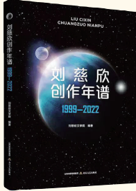
《刘慈欣创作年谱1999—2022》书影