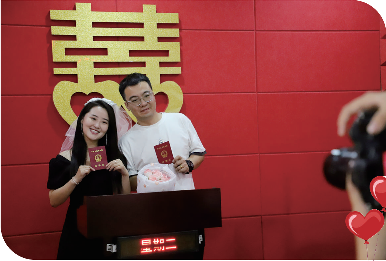
8月22日,农历七月初七,是我国传统节日“乞巧节”,不少情侣选择在这天登记结婚。当日,万柏林区婚姻登记处有145对新人领取了结婚证。

七夕节又称“乞巧节”,是向织女祈求心灵手巧、平安健康的重要节日。8月22日下午,以“‘衍’绎精彩、‘纸’见晋祠”为主题的乞巧小课堂,在晋祠博物馆青少年社会实践活动教育基地开展,为孩子们讲述了七夕的来历和传统文化习俗,通过衍纸画的独特方式,把平面、单薄的纸变为具有奇妙立体感的圣母殿,让孩子们在亲自动手实践的过程中,了解中华优秀传统文化。 晋祠博物馆“我们的节日·七夕”系列文化活动,再现传统服饰之华美、华夏礼乐之仪范,通过寓教于乐的方式架古今桥梁、润明澈童心,深入挖掘根植于中华民族基因中的优秀文化特质,彰显中华优秀传统文化的当代价值和时代意蕴。 (陈辛华、贾尚志)