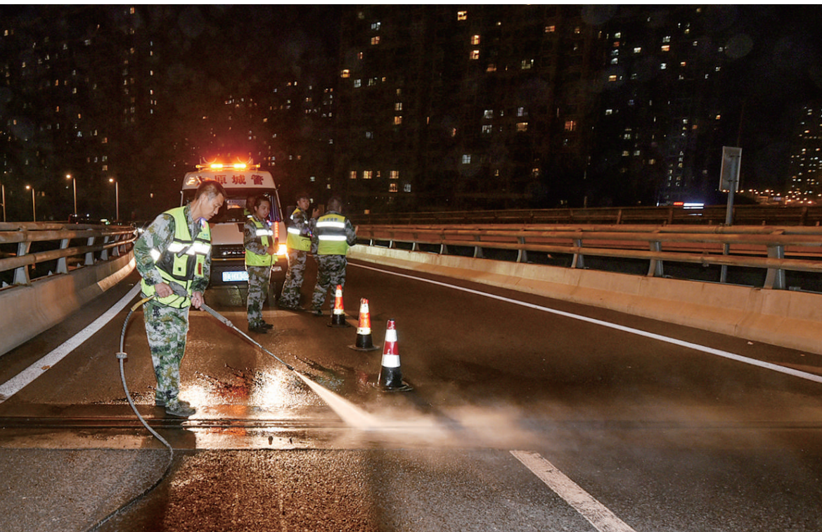
八月二十九日晚,市市政公共设施建设管理中心应急保障站的排水畅通。工作人员对东中环路桥梁伸缩缝、泄水孔进行清理,确保桥梁