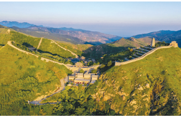
这是8月30日拍摄的雁门关（无人机照片）。雁门关位于山西代县，是长城重要关隘之一，历来为兵家必争之地。2001年，长城雁门关段被国务院公布为全国重点文物保护单位。

山西省水利厅厅长龚孟建说，山西会锚定“全面抓节水、用好黄河水、多用地表水、涵养地下水、统筹再生水”的水资源总体配置思路，全力建成“三横四纵、五库连通”的市级现代水网，为大同“融入京津冀、打造桥头堡”提供更有力的水支撑水保障。