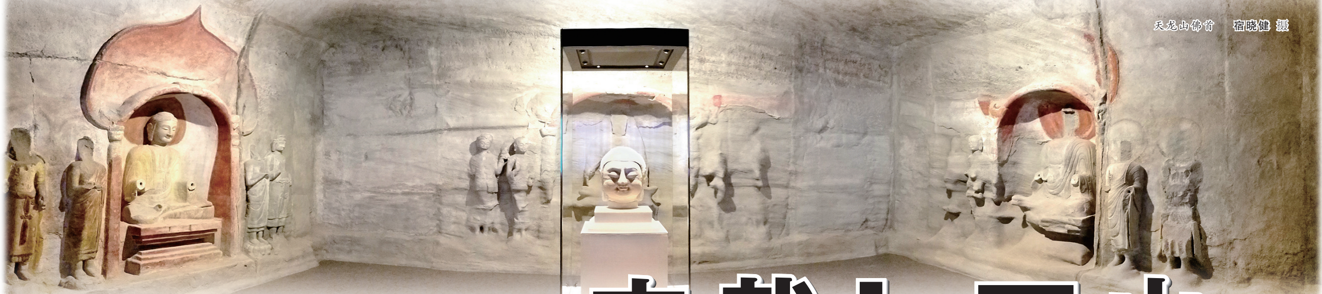
天龙山佛首