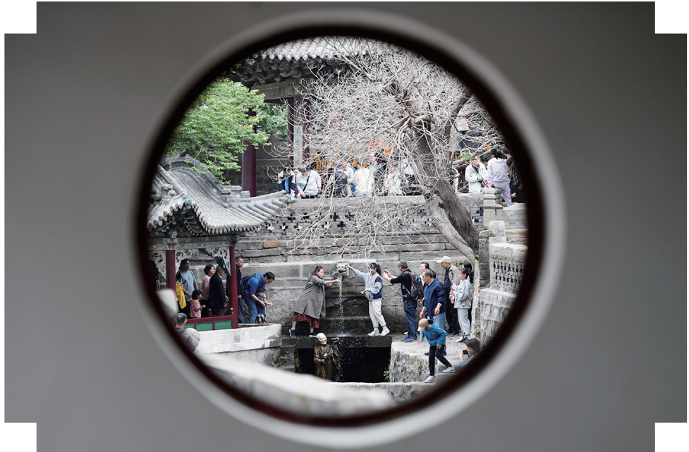
晋祠难老泉

有名的古晋阳八景中，“烈石寒泉”“土堂怪柏”“崛围红叶”“蒙山晓月”，所见皆在西山。