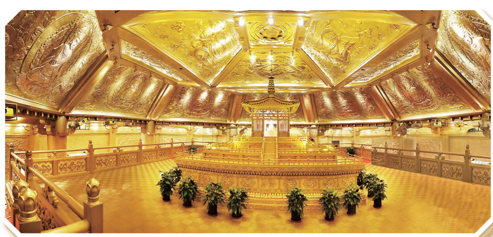
太山博物馆唐佛塔遗址展厅

夏日炎炎，走进烈石山下窦大夫祠，耳边汾水涛涛，眼前古木参天，心中顿生凉意。而这样