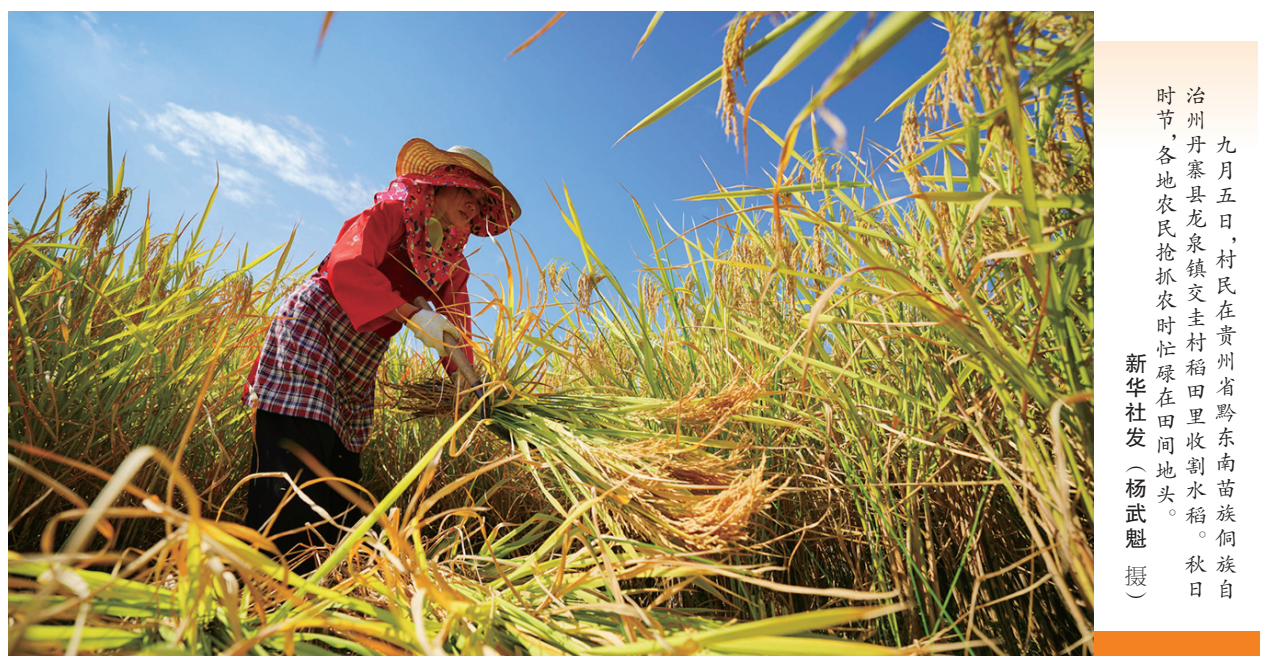
九月五日,村民在贵州省黔东南苗族侗族自治州丹寨县龙泉镇农时忙里收割水稻。秋时节,各地农民抢抓农时忙里收割水稻。

活、开展交流互动。五是开展群众性宣传教育活动。开展“爱我国防”演讲、国防知识竞赛和征文、国防体育运动系列赛事、国防竞技、国防科普巡展、兵棋推演大赛、“国防万映”公益电影展映等活动,用好宣传展板、公益广告、文艺汇演、灯光秀等形式,营造全民参与国防教育的浓厚氛围。六是开展网上宣传教育活动。组织中央和地方重点新闻网站、“学习强国”学习平台开设全民国防教育月专题网页,推出“爱国强军”系列话题,更好地汇聚正能量、振奋精气神。 《通知》要求,要牢牢把握正确政治方向,坚持团结稳定鼓劲、正面宣传为主,坚决反对和抵制错误观点。要充分利用传统媒体和新兴媒体,积极创新方法手段,紧贴受众需求实际,力求宣传教育活动丰富多彩、生动活泼。各级党委宣传部门要牵头抓总、统筹安排,各有关部门要密切配合、精心组织,形成上下联动、广泛覆盖的生动格局。