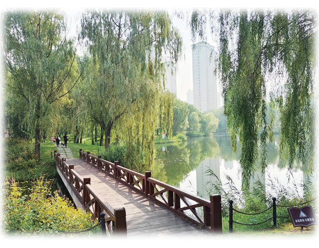
祥云公园美景

回望祥云公园,上万株持续怒放的月季花后面,是树林、草坪、野花、山石、湖泊、小桥、花廊等诸多美景的相互辉映。它们各自恪守着自己的职责,合力构成一幅优美的疏林草地生态画卷。 天蓝水碧,不觉又回到原点。公园门口,诸多游人依然在一个个美食摊前流连。孩童们欢快地吃着烤串,女孩子优雅地吃着灌肠,小伙子们豪迈地喝着啤酒……多么像家乡的集市啊!不甘心就这样回去,于是拉着姐姐也向着那些香味撩人的小摊走去。 我这个外乡人,也必须要感受一番这烟火气!