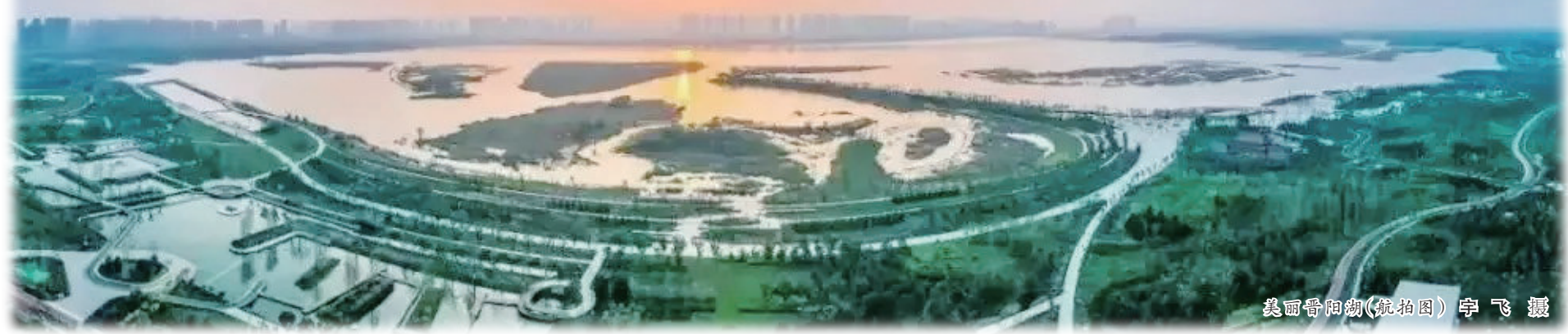
美丽晋阳湖(航拍图)

当我穿过浓云掩盖的暮色,呼吸到新雨初霁后微润清朗的空气时,我知道,我到家了。 两个小时的空中旅程,跨越长江黄河等一众水系,静候红日从天边落尽,繁星升起。当飞机开始降落,我守在舷窗边,看着故乡的山山水水逐渐被暗夜吞没,看着飞机掠过湖面上月轮的倒影,内心腾起一种既亲切又陌生的感觉。我认识那些楼宇,那些街道,没错的,也一定不会错,可是当我俯视那连绵的山脉和密布的水网时,我竟有些恍惚,心中无比惊异:离家求学三年有余,竟不知故乡何时变了模样? 在我踏上熟悉的土地的那一刻,那些疑虑便自然而然地打消了,但那种久久萦绕、挥之不去,进而愈发强烈的惊异之情,却像羽毛一样撩拨着我的心,迫使我去一探究竟。 都说它是“表里山河上的明珠”,可对太原人来说,它更亲切、更遥远的一个名称,是“晋阳城”。太原哪里风景最好?恐怕见仁见智,可若问我哪里是看风景的绝妙之处,那么晋阳湖当之无愧。 与其说是湖,不如说是一个微缩的海,虽不是无边无际,倒也有浩浩荡荡之势。以吕梁余切为表,以万顷晋水为里,连接东西两城,覆盖5平方千米有余,中有岛屿阻拦分隔,水流却暗自相通。从木构工巧的前厅进入,便可见花团锦簇,盆景夹道相迎。不远处的林木葱葱郁郁,树叶的罅隙间透出些许微波点点,不消说,那就是晋阳湖了。 我决定沿湖漫步。土膏微润,一望空阔,湖边潮湿清新的空气溢满鼻腔,让人顿觉舒心爽朗。“沙蒲偃秋风,湖云藏夕雨”,仲夏入秋,水天一色,高远辽阔,行走于天地间,感慨油然而生,大美不言自明。廊桥一痕,曲折回环;鸳鸯闲游,鸟雀信步;浮萍聚散,随波荡漾;舟子不渡,谈