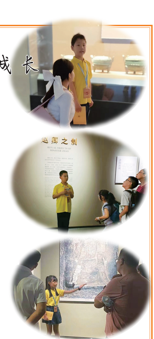
以上图片为山西青铜博物馆暑期小小讲解员正在认真讲解。

有体会,一件文物的背后蕴藏着大量的历史知识,也许是一个典故,也许是一个家族曲折的经历,也许是一个国家波澜壮阔的兴衰,也许是掩埋在黄沙下永不为人知的秘密。然而你似乎又能从一些蛛丝马迹中找到这些文物和我们文化脉络的联系,跨越千年,遗世独立。也许这就是博物馆的魅力,探寻未知的过去和那个真正的自我。