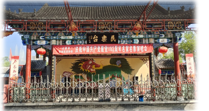
饮马河公园民乐台

宋天圣三年(1025),陈尧佐任太原知府,为防止汾水泛滥,用“添土增防,植树固堤”法修筑汾东长堤,堤上杨柳依依,有数万株之多,堤中引水蓄湖,称为“柳溪”。后来的龙潭湖—饮马河—西海子—南海子—文瀾湖—迎泽湖等串起来十几公里城西水系,都是在柳溪的基础上发展而来。而饮马河旧时地近学宫,故人们称其为文漪湖。饮马河与后小河古时也相通,明太原三卫驻军常饮马于此,这才改名饮马河。以饮马河而名的街巷则延续至清代,称饮马河,后来又有饮马河街、饮马巷。饮马河街今称饮马河,蓝底白字的标牌清晰可见。