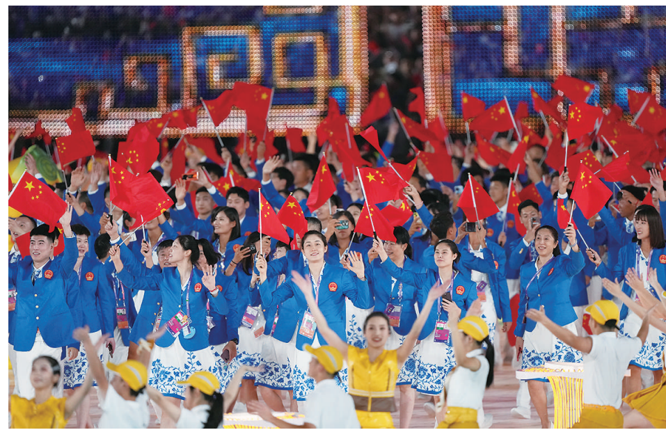
9月23日，中国代表团在开幕式上入场。新华社记者 杜宇 摄

限制，成为“数字火炬手”，直接参与到亚运盛会中。 夜幕下，“数字火炬手”跨越波澜壮阔的钱塘江，从远方奔赴而来，终于抵达杭州奥体中心体育场上空。 22时整，承载着全亚洲乃至全球民众的热情期盼，“数字火炬手”和最后一棒火炬手汪顺一起，点燃象征亚洲大团结的亚运之火，点亮体育之梦、幸福之梦、亚运之梦。“薪火”相传，主火炬以零碳甲醇作为燃料，在亚运史上首次实现低碳再生。 这一刻，时空消融，数字世界与现实世界同频共振，亚洲风采绽放耀眼光芒！ 这是一场凝聚团结力量的盛会—— 亚运赛场上，体育健儿将各展所长。更快、更高、更强——更团结，即便是争拼，也是同行的伙伴。因为亚洲人民深知：作为山海相连、人文相亲的命运共同体，亚洲要穿越惊涛骇浪、驶向光明未来，必须同舟共济。 这是一场激荡亚洲精神的盛会—— 岁月如歌，走过72载的亚运会，已成为亚洲最具规模和影响力的体育盛会。亚运发展史，也是亚洲人民勠力进取的奋斗史，是亚洲人民自立自强的变革史。亚洲的发展腾飞，亚运会是见证者、参与者、推动者。 这是一场促进开放交融的盛会—— 亚运会架起友谊和沟通的桥梁，让不同语言、不同肤色、不同文化背景的亚洲人平等交流、同行。 这场盛会不仅是体育竞技的舞台，也是文明交流的纽带。通过多元文化碰撞交融，亚洲人民进一步增进友谊，在交流互鉴中续写亚洲文明新辉煌。 “你和我同住亚洲，同呼吸同感受同梦想，同爱同在同分享……”在主题曲《同爱同在》的温暖旋律中，亚洲人民再一次携起手来，满怀梦想，心心相融，爱达未来。 新华社记者（新华社杭州9月23日电）