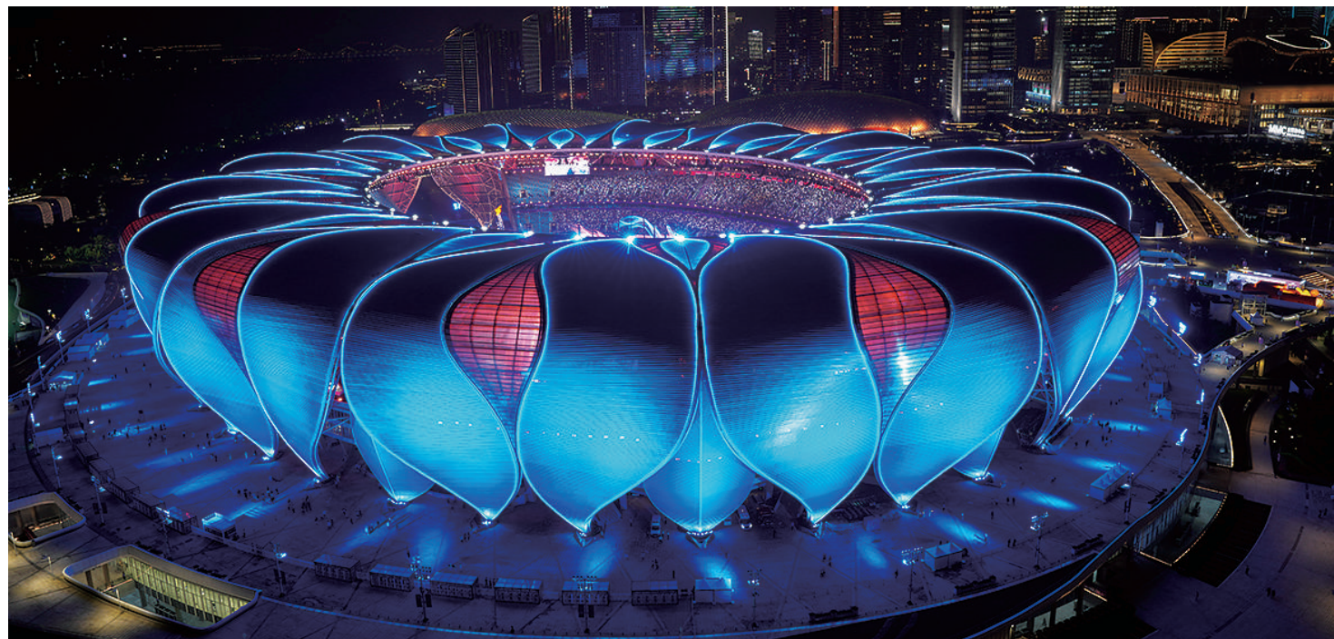
这是9月23日拍摄的杭州奥体中心体育场。