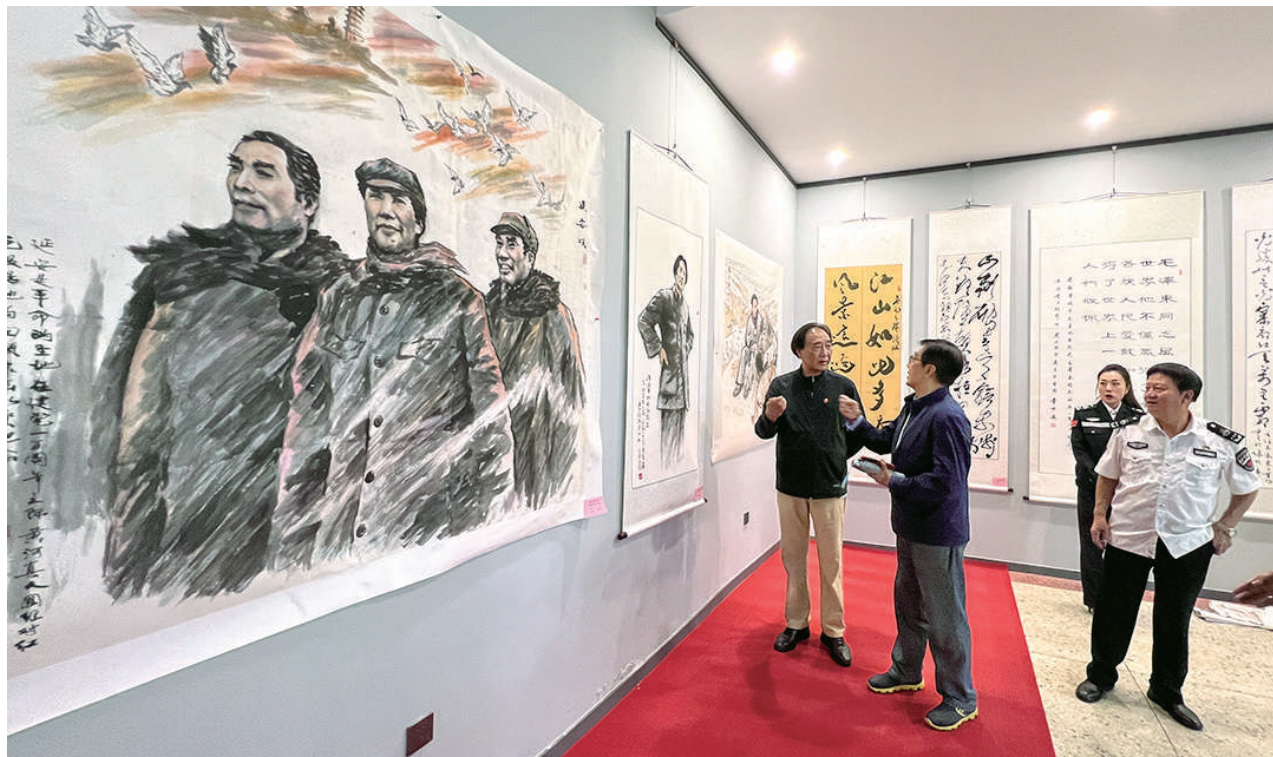
9月24日,“迎国庆·颂党恩”书画展在山西神墨美术馆开展。来自全省38位书法家的153幅书画作品用深情的笔触赞颂党的辉煌成就,营造喜迎国庆的节日氛围。

城直供基地举行授牌仪式;举办果品出口高端对话,由中国果品流通协会主办中国果协果品国际贸易交流大会,以“运城果业对接国内国际大市场”为主题,邀请知名专家学者,专场开展果品出口经验交流,提升山西果品自营出口能力;推出现代果业运城模式,举办中国园艺学会苹果分会2023年会暨现代果业轻简集约技术论证会,邀请国家苹果产业技术体系专家,重点对运城果业高质量发展新品种、新技术、新模式进行论证,推出“运城模式”;组织网红达人直播带货,邀请体育冠军、网红达人、知名电商、网红果农开展直播带货,扩大果品品牌的知名度,提高山西果业的竞争力。 (周皓)