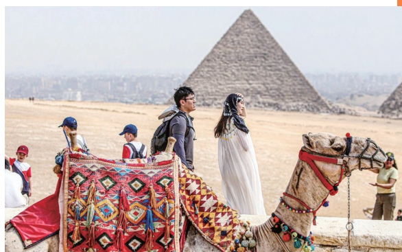
10月4日,中国游客在埃及吉萨金字塔景区游览。