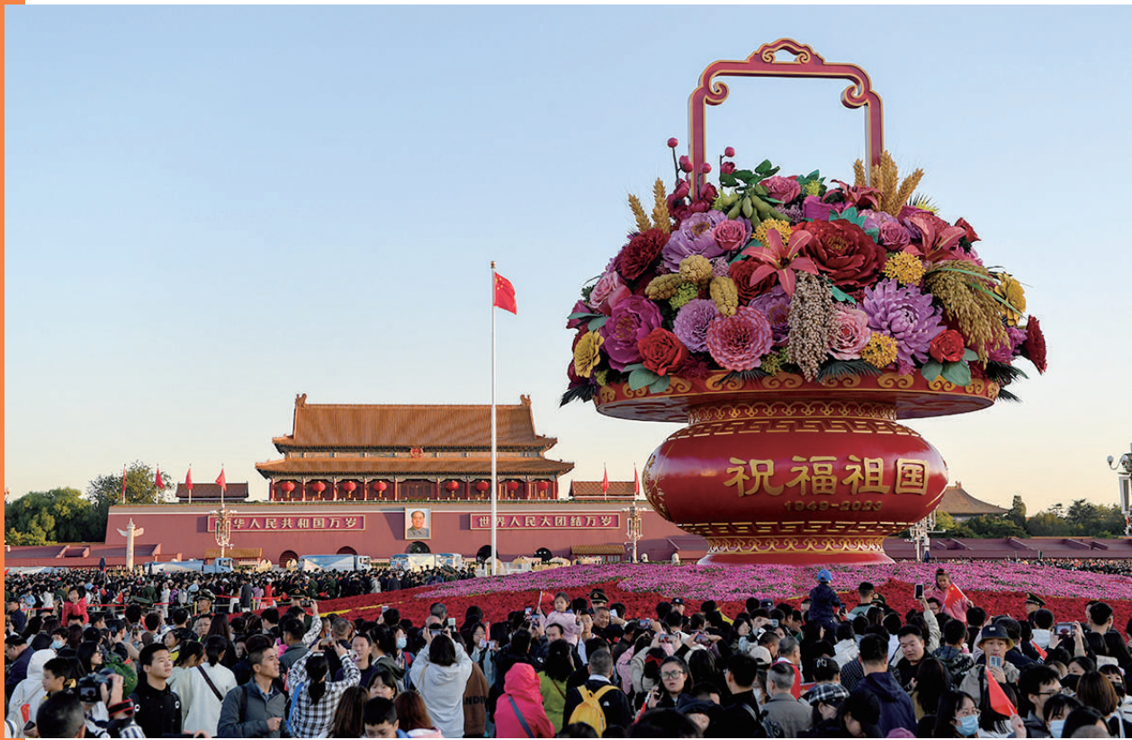
10月1日,在观看升旗仪式后,人们在北京天安门广场参观。新华社记者 鞠焕宗 摄

高速公路川流不息,景区景点“人从众”,大型商超人气火爆,电影市场红火向好……今年恰逢中秋、国庆双节并行,超8亿人次出游、国内旅游收入超7500亿元,持续上涨的热情、不断刷新的数据,映射出人们对美好生活的期盼,彰显着中国经济的澎湃活力。