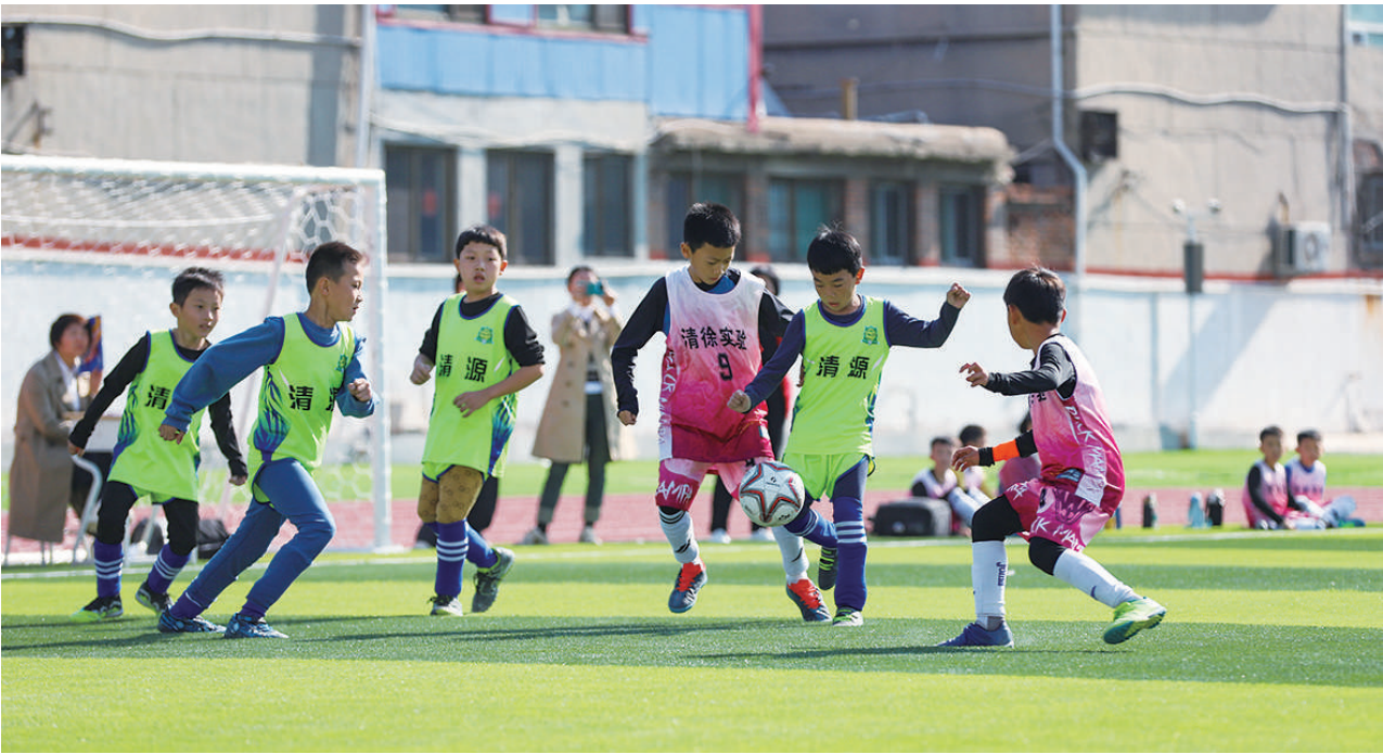
10月9日,2023年清徐县小学生足球联赛在清源镇初级中学拉开帷幕后,来自全县各小学38支队伍530余名学生参加。