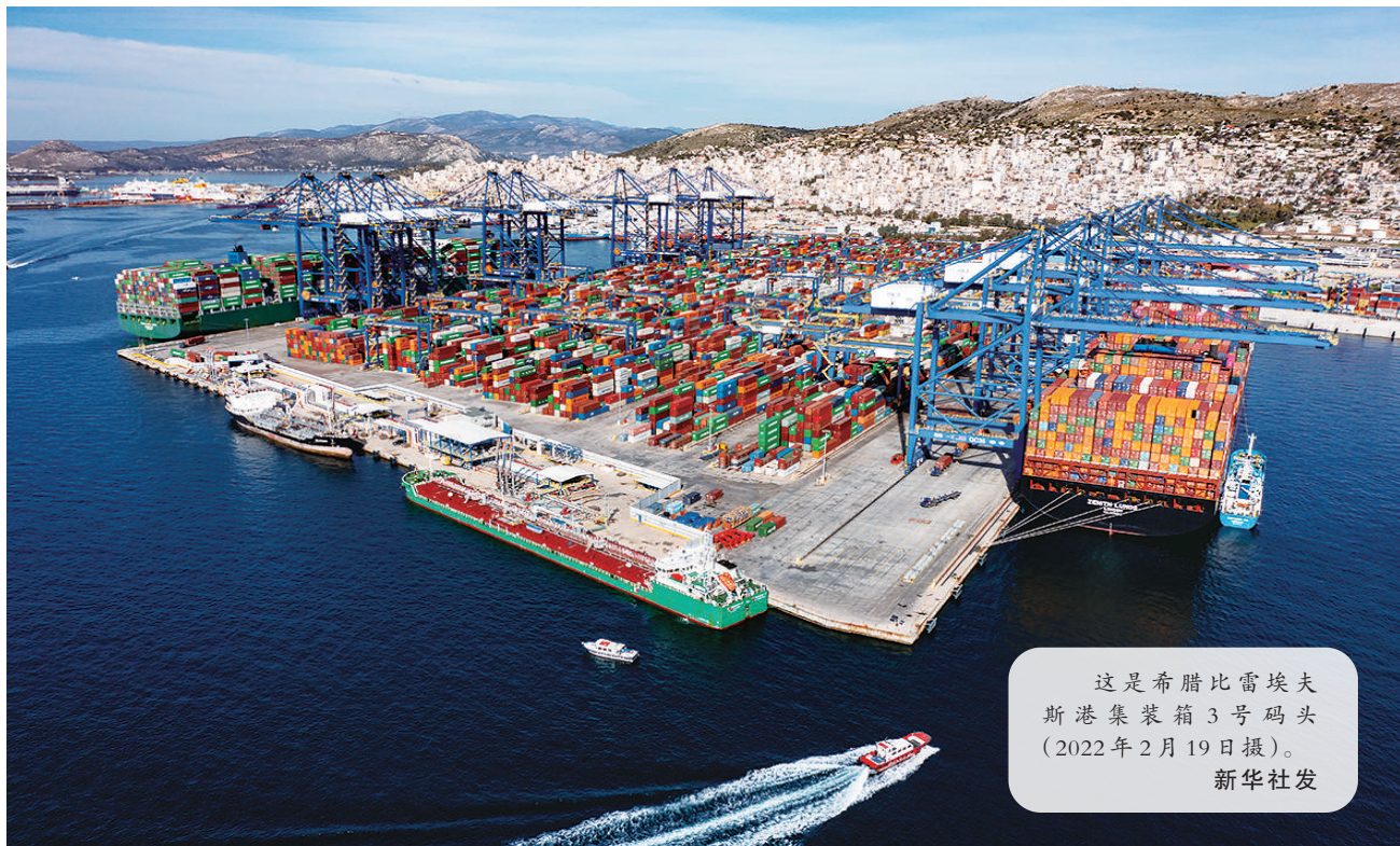
这是希腊比雷埃夫斯港集装箱3号码头(2022年2月19日摄)。

中国坚持人民至上、生命至上，始终把人民生命安全和身体健康放在第一位，在共建“一带一路”过程中同样