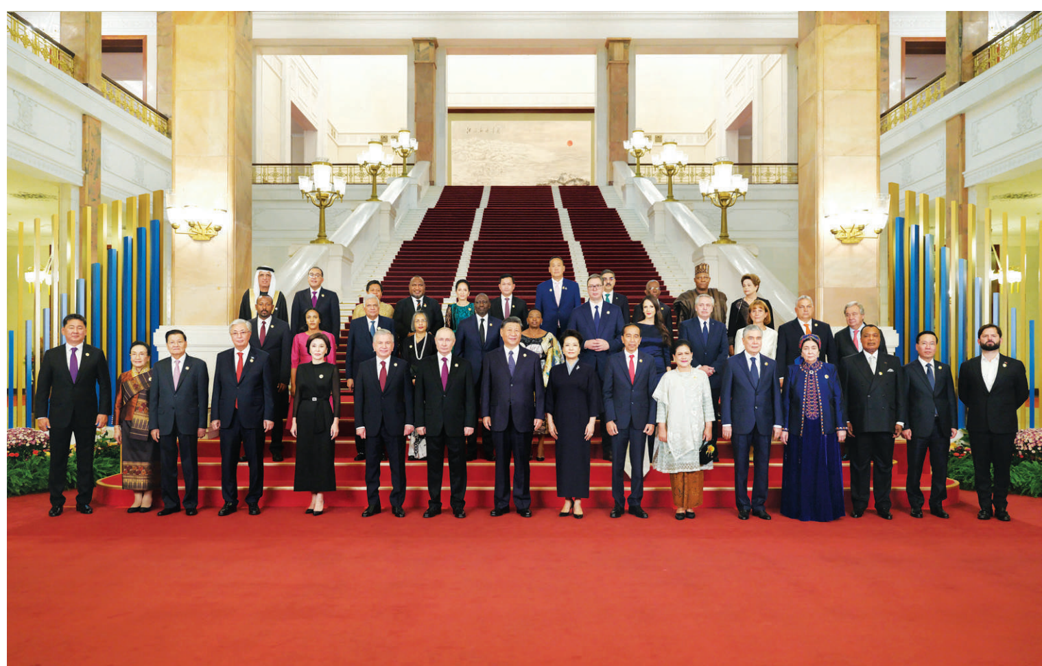
10月17日晚,国家主席习近平和夫人彭丽媛在北京人民大会堂举行宴会,欢迎来华出席第三届“一带一路”国际合作高峰论坛的国际贵宾。这是习近平和彭丽媛同国际贵宾合影留念。

新华社北京10月17日电(记者 杨依军、孔祥鑫)10月17日晚,国家主席习近平和夫人彭丽媛在人民大会堂举行宴会,欢迎来华出席第三届“一带一路”国际合作高峰论坛的国际贵宾。李强、赵乐际、王沪宁、蔡奇、丁薛祥、李希、韩正出席。 秋日北京,夕阳入画,天安门广场华灯绽放,人民大会堂庄严肃穆。 出席高峰论坛的外国国家元首、政府首脑、国际组织负责人等国际贵宾及配偶陆续抵达人民大会堂。礼兵列队致敬。150多面共建“一带一路”国家国旗和联合国旗,整齐并列红毯两侧,恢宏壮观。