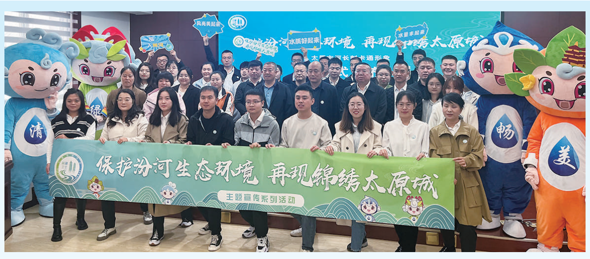
主题宣传系列活动启动仪式现场。