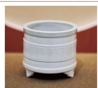
定窑白釉三足桶式炉