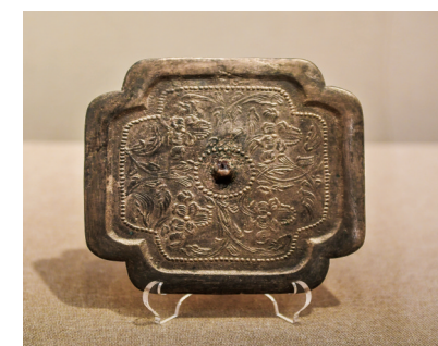
四花枝纹亚字形镜