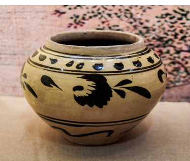
白釉黑花花鸟纹罐