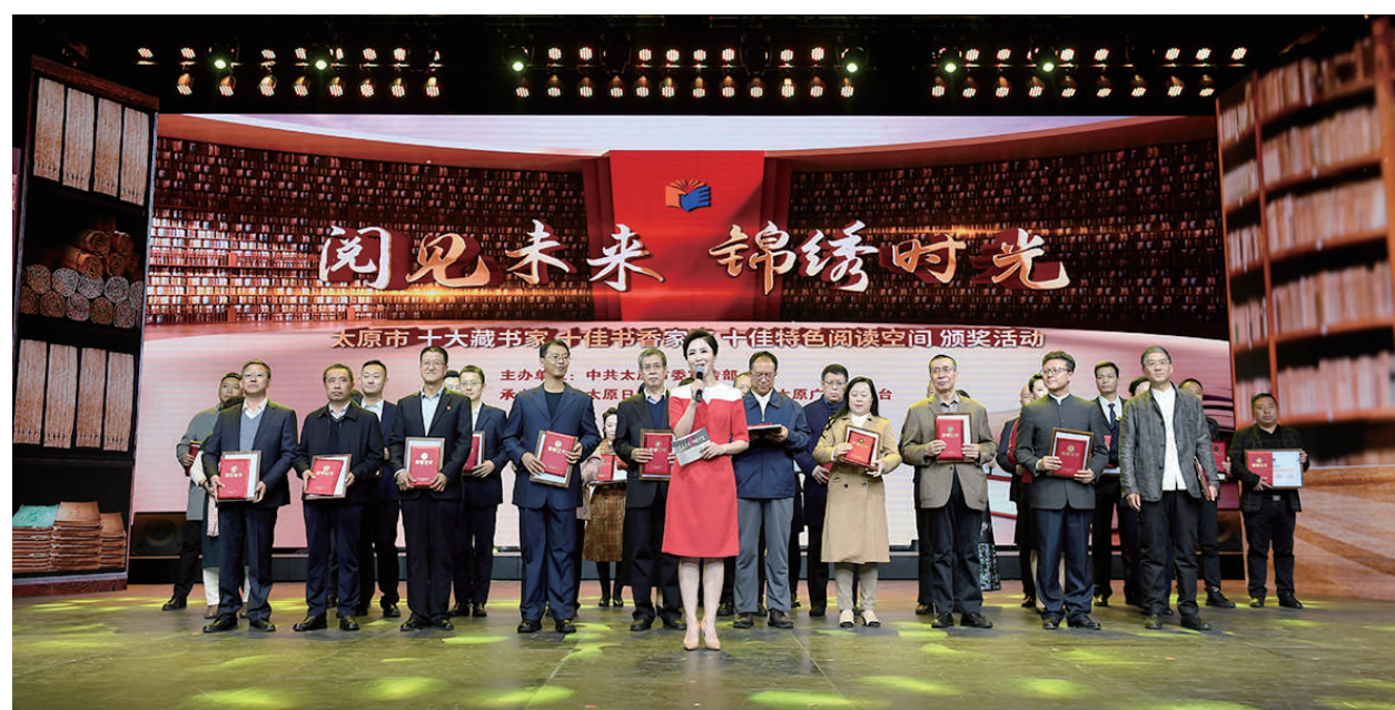
11月8日,“阅见未来·锦绣时光”——太原市十大藏书家、十佳书香家庭、十佳特色阅读空间颁奖活动在太原广播电视台举行。