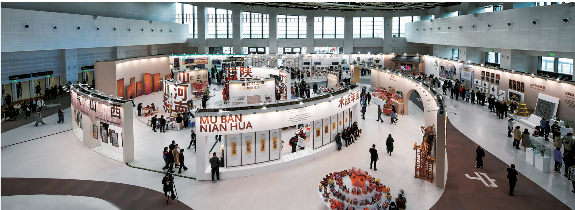
黄河非遗大展展厅