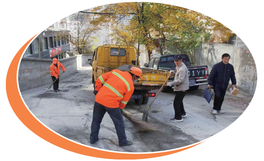
图为工作人员修整路面。