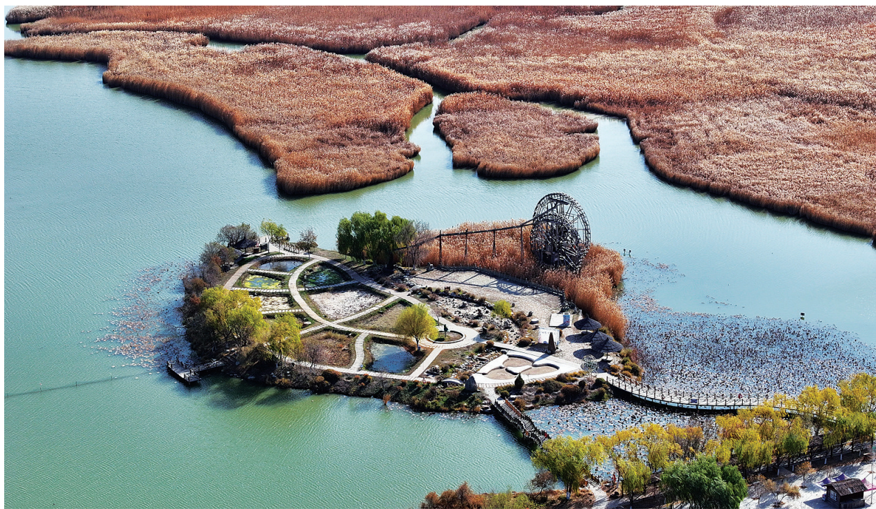
鸣翠湖国家湿地公园初冬景色(无人机照片,11月10日报)。 立冬节气过后,位于宁夏银川市兴庆区的鸣翠湖国家湿地公园,金黄色的芦苇随风飘荡,各色林木五彩斑斓,构成独特的初冬湿地景观。