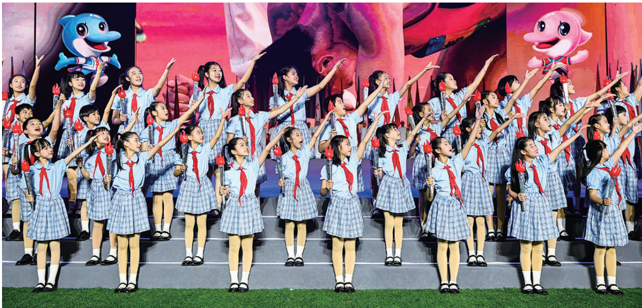
11月15日，少先队员在闭幕式上表演。当日，第一届全国学生(青年)运动会闭幕式在广西南宁举行。

全国政协副主席兼秘书长王东峰在致辞中表示，习近平主席提出构建人类命运共同体理念，受到国际社会特别是广大发展中国家普遍欢迎和广泛支持，为共建持久和平、普遍安全、共同繁荣、开放包容、清洁美丽的世界作出重要贡献。我们愿同国际社会一道，协力建设开放型世界经济，携手同行现代化之路，共同推动人类文明发展进步。中国全国政协将继续支持中国经济社会理事会加强与世界各国朋友往来，深化治国理政经验交流，助推各领域务实合作，为创造人类更加美好的未来共同努力。